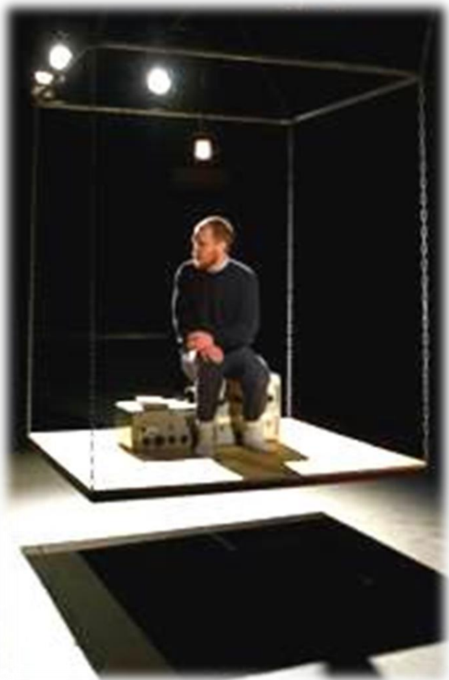
Úr leikritinu Mar í Frystiklefanum á Rífi