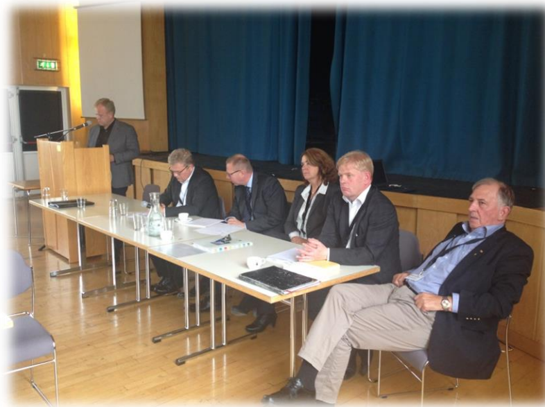
Pallborð á málþingi SSV í Búðardal

Málþing og framhaldsaðalfundur SSV fór fram í Búðardal 18. september. Alls sátu fundinn 48 fulltrúar og gestir. Sérstakur gestur fundarins var Hanna Birna Kristjánsdóttir innanríkisráðherra, en auk hennar sátu þingmenn úr Norðvestur-kjördæmi, framkvæmdastjóri Sambands íslenskra sveitarfélaga, starfsmenn úr innanríkisráðuneyti og aðilar frá öðrum landshlutasamtökum og Byggðastofnun sem gestir.