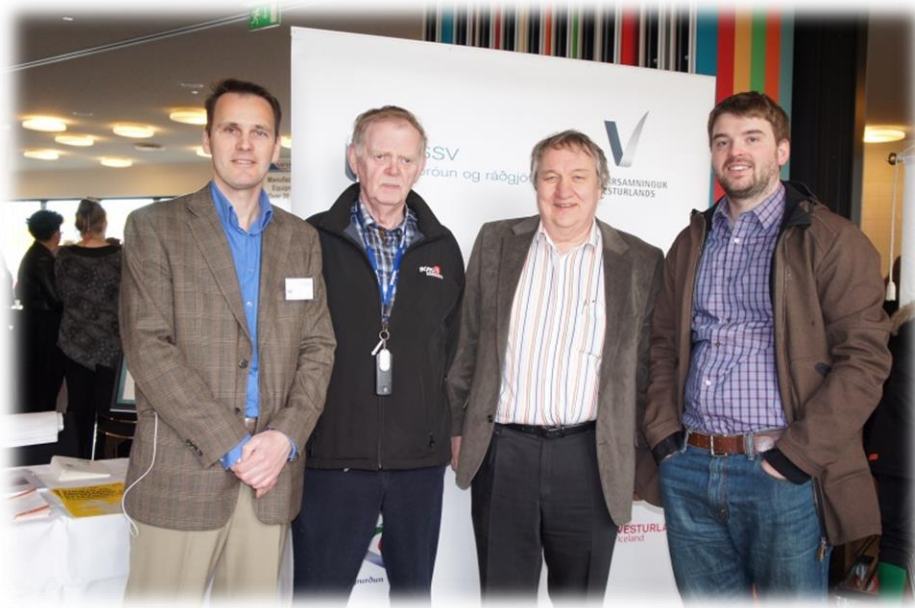
Frá atvinnusýningu í Borgarnesi

Atvinnuráðgjöfin fær um eða yfir 4 þús. fyrirspurnir og erindi á ári, sem eru af margvíslegum toga eins og verkefnalisti hér að ofan gefur til kynna.