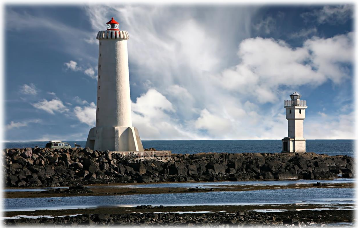
Vitarnir á Akranesi

Í nýjum lögum Samtaka sveitarfélaga á Vesturlandi (SSV) sem samþykkt voru á framhaldsaðalfundi s.l. haust kemur fram að á aðalfundi skuli leggja fram skýrslu um starfsemi samtakanna. Starfsmenn SSV hafa unnið að því undanfarið að taka saman þá skýrslu sem hér er lögð fram. Það er von okkar að skýrslan gefi glögga mynd af þeim verkefnum sem SSV sýslar með og verði sveitarfélögum, fyrirtækjum, stofunum, hagsmunasamtökum og einstaklingum góð heimild um starfsemina. Tilgangurinn með útgáfu á skýrslu sem þessari er líka að fræða og miðla þekkingu á þeim verkefnum sem unnin eru á vettvangi landshlutasamtaka, gera þær upplýsingar aðgengilegri og stjórnsýsluna gegnsærri og opnari.