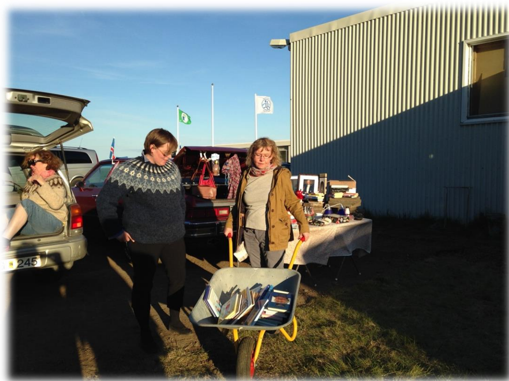
Skottmarkaður og skemmtilegheit