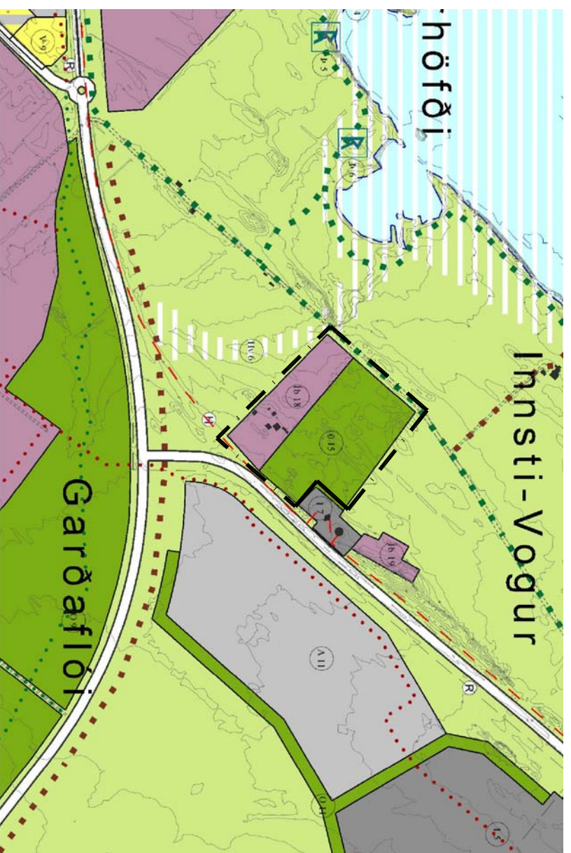
Breytt skipulag kvarði 1:10.000