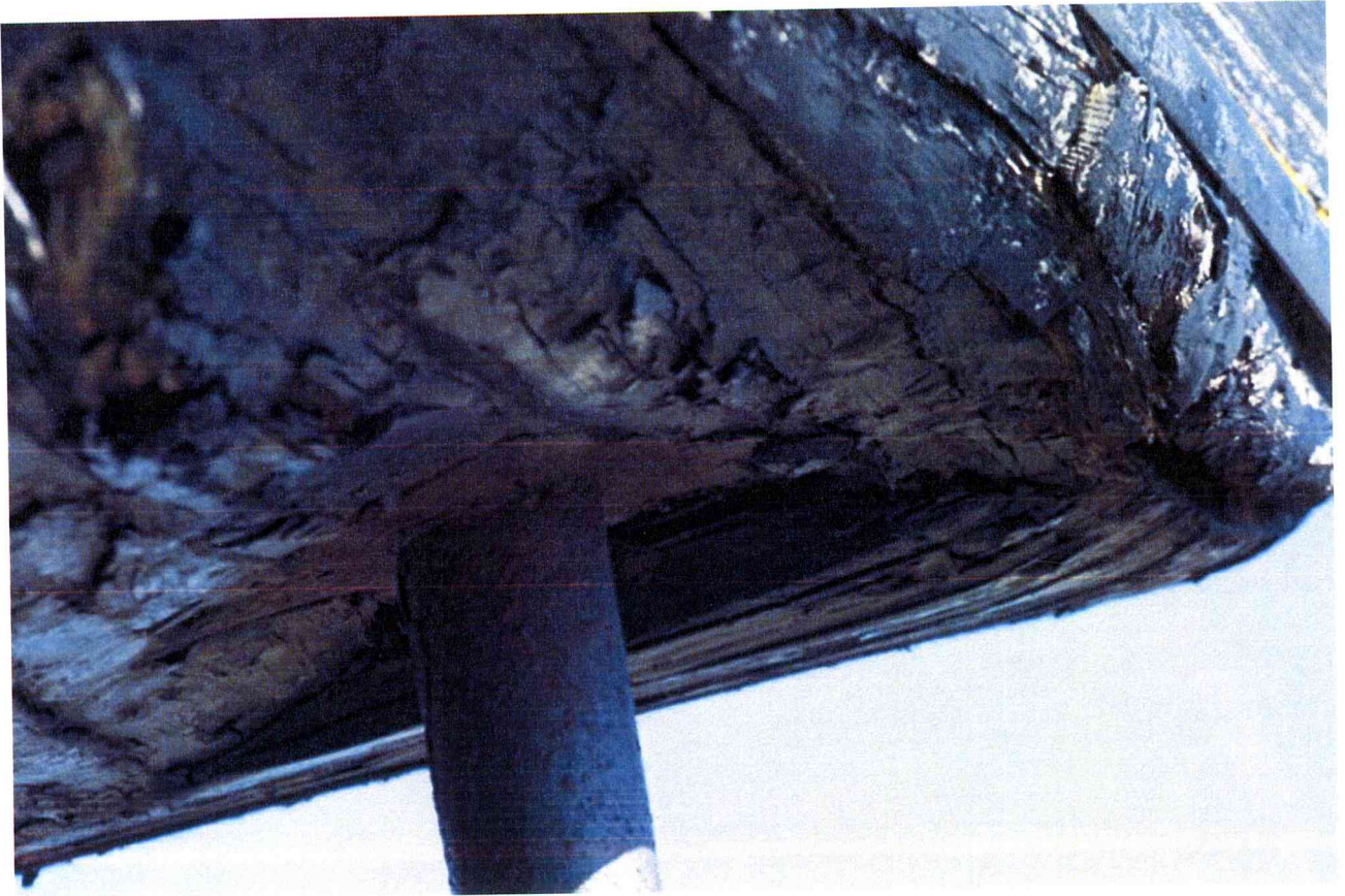
Afstivningen under hækken/agterspejlet. Det ses hvordan konstruktionen nu synker ned over afstivningen.