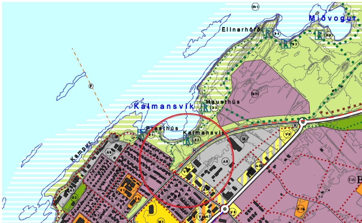
Mynd 1: Aðalskipulag Akraness 2005–2017. Rauður hringur dreginn um svæðið sem breytingin á við.

Mörk hverfisverndar verða dregin með meiri nákvæmni en gert er á gildandi aðalskipulagsupprætti og munu miðast við sjóvarnargarð og gangstíg.