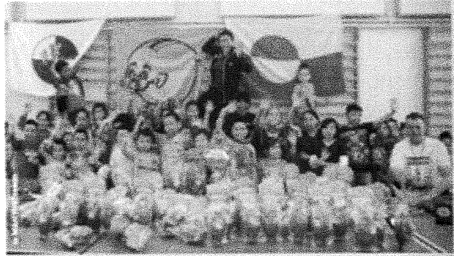
Ilalandimeeqq Hebrukerinnit illoqortormitt Nunatsinni ukiumoortunni ukiumoortuq...