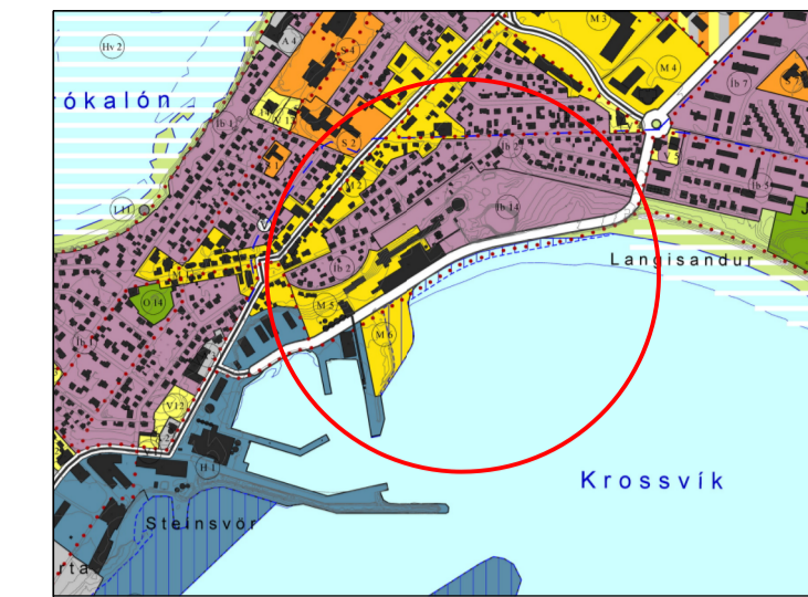
BREYTING Á AÐALSKIPULAGI AKRANESS 2005-2017 FYRIR SEMENTSREIT OG HAFNARSVÆÐI, SAMÞYKKT Í BJAARSTJÓRN 12.09.2017