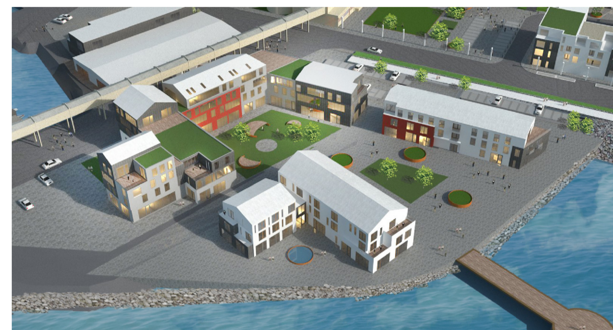
Reitur I - J