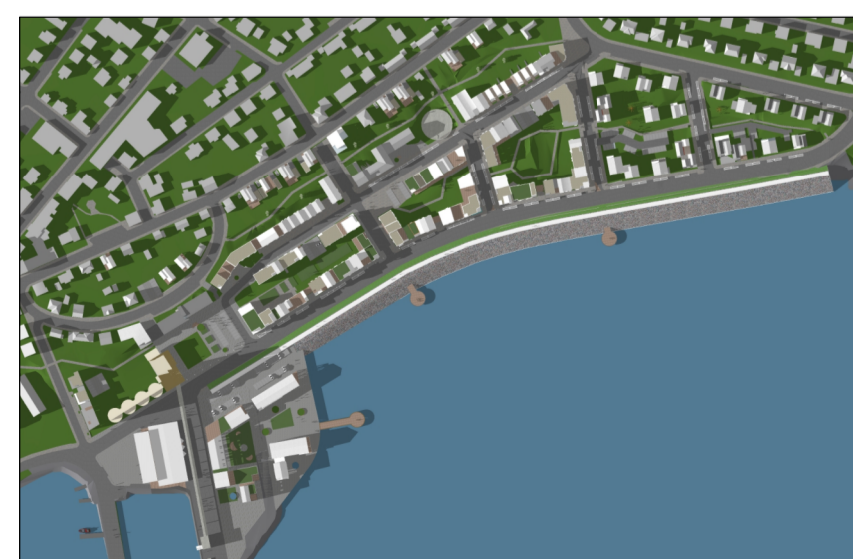
Skuggavarp 21. mars kl. 17

Útgáfa B 18.05.2018 - Skorsteinn fjarlægður. Útgáfa A 13.11.2017 - Samræming á skilmálum, teikningum og rúmmyndum. Kotasettar jarðhæðir og kjallara við Faxabraut (Hólabakkta). Lúgðarur sýndur hvar aðalaskjalagis. Samræmdir málakvæðar á grunnuppdráttum. Nánari skýring af "uppbrottum í þökum" og "móðlungs varðveisluhlíði".