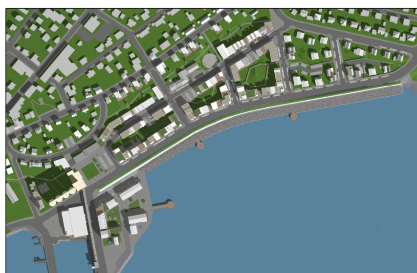
Skuggavarp 21. mars kl. 10