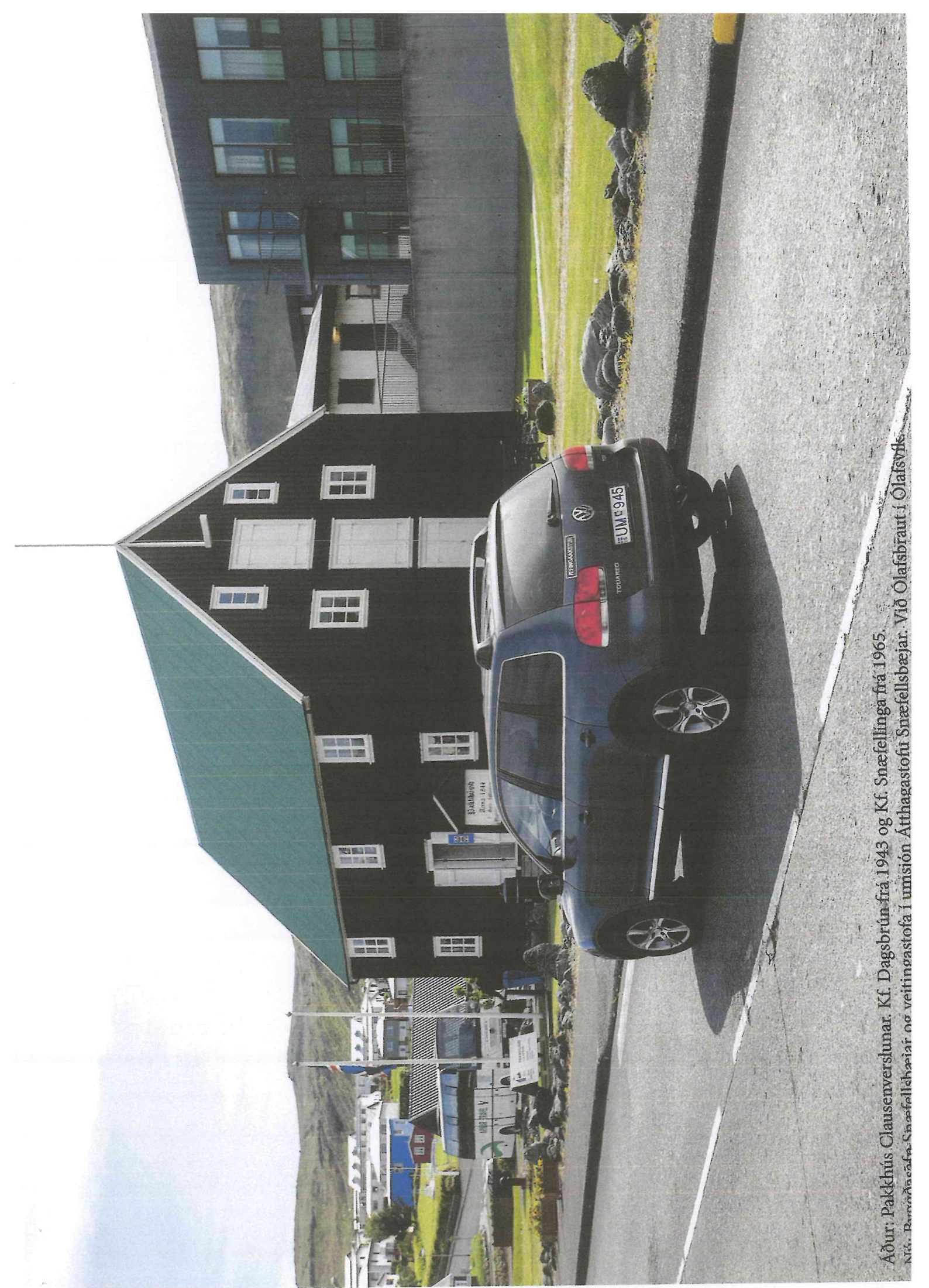
Áður: Pakkhús Clausenverslunar. Kf. Dagsbrúin frá 1943 og Kf. Snæfellinga frá 1965. Nú: Þarróðvæðing. Snæfellingar og veitingastofa í umsjón Atthagastofu Snæfellsbæjar. Við Olafsbráut í Olafsvík.