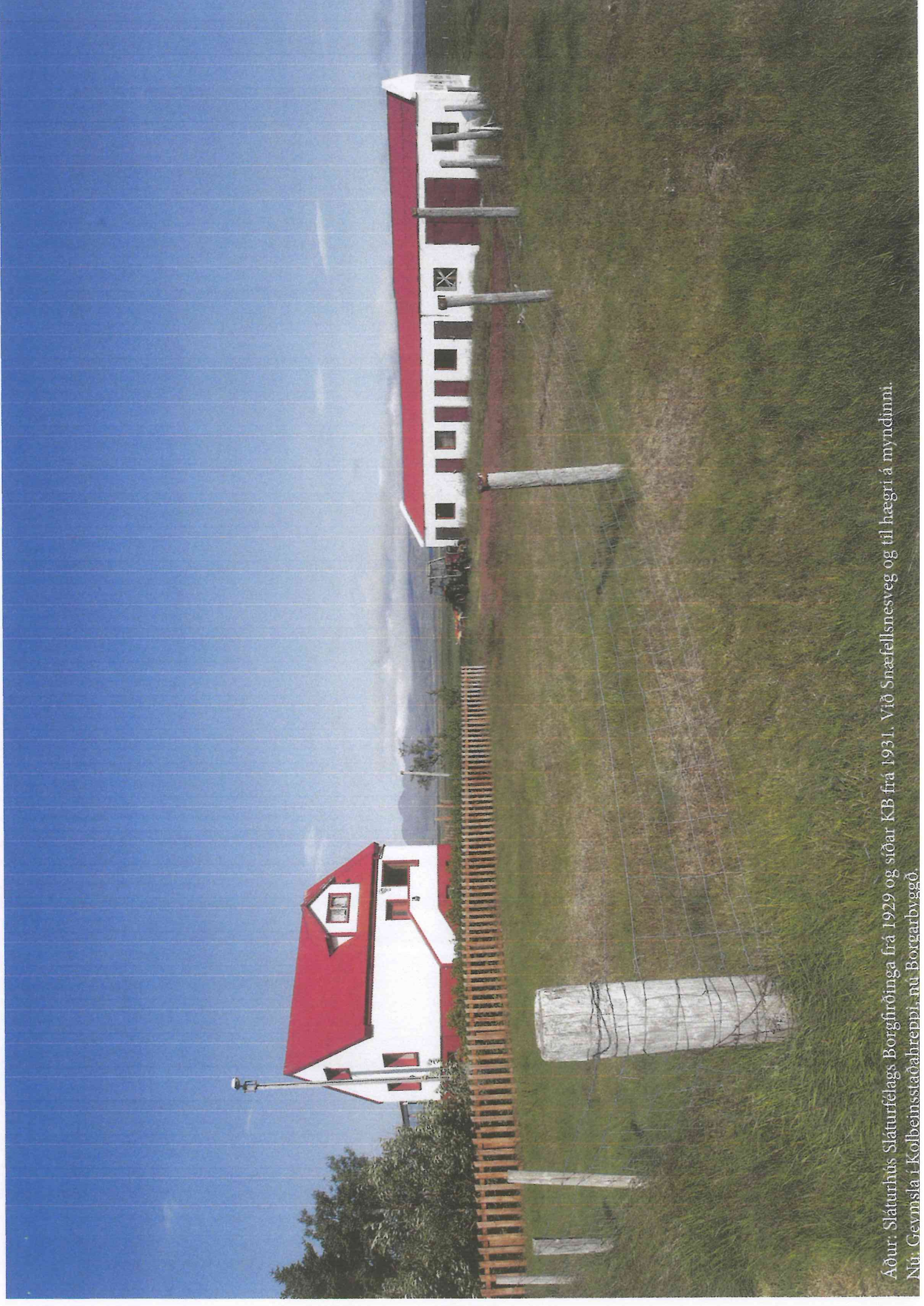
Áður: Sláturhús Sláturfélags Borgfirðinga frá 1929 og síðar KB frá 1931. Við Snæfellsnesveg og til hægri á myndinni. Nú: Gevmsla í Kolbeinsstaðabreppi, nú Borgarbyggð.