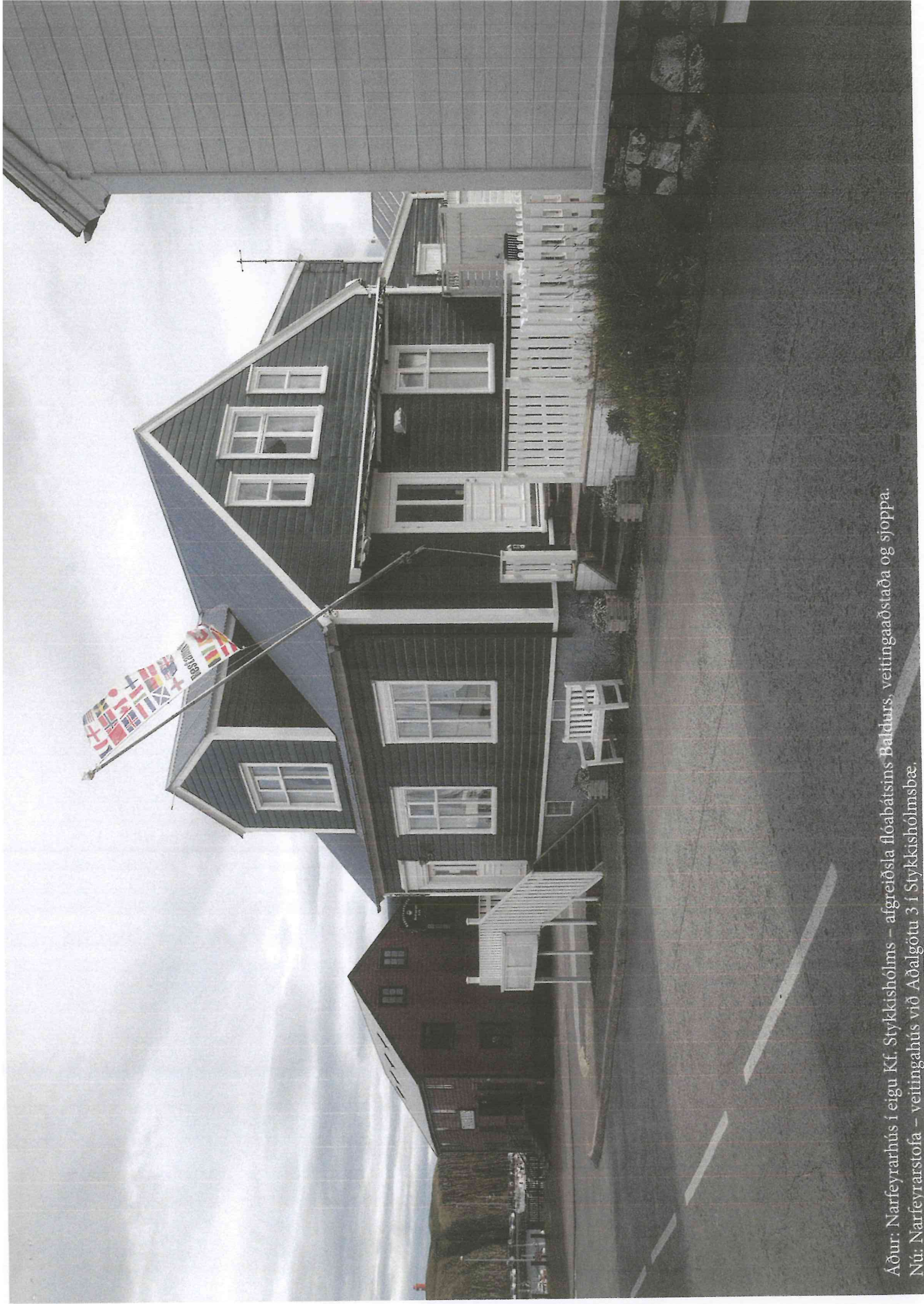
Áður: Narfevjarhús í eigu Kf. Stykkishólms – afgreiðsla flóabátsins Baldurs, veitingaaðstaða og sjoppa. Nú: Narfevjarstofa – veitingahús við Aðalgötu 3 í Stykkishólmsbæ.