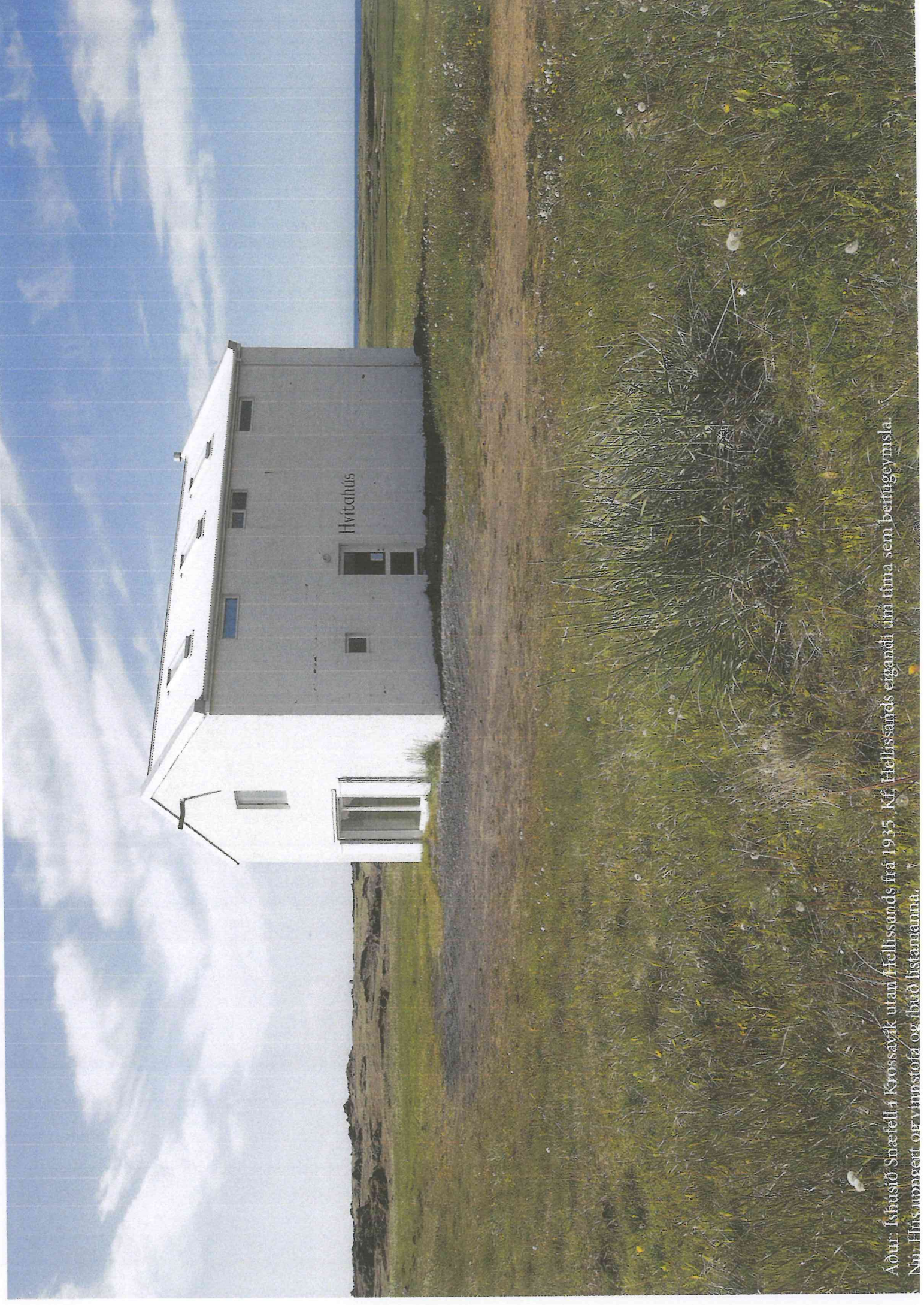
Aður: Ishúsið Snæfelli 4 Krossavík utan Hellissands frá 1935. Kf. Hellissands eigandi útrífta sem betingeymsla. Nú: Hús umgeert orvinnstofa og íbúð listamanna.