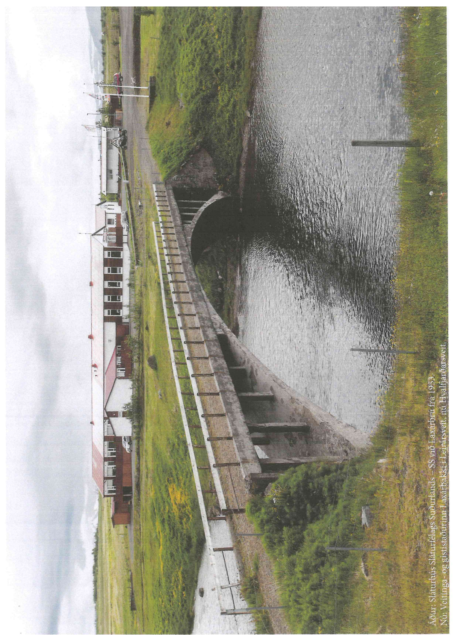
Aður: Sláturhús Sláturfélags Suðurlands – SS við Laxárbrú frá 1953. Nú: Veitinga- og gististaðurinn Laxárbaeki í Leirarsveit, nú Hvalfjarðarsveit.