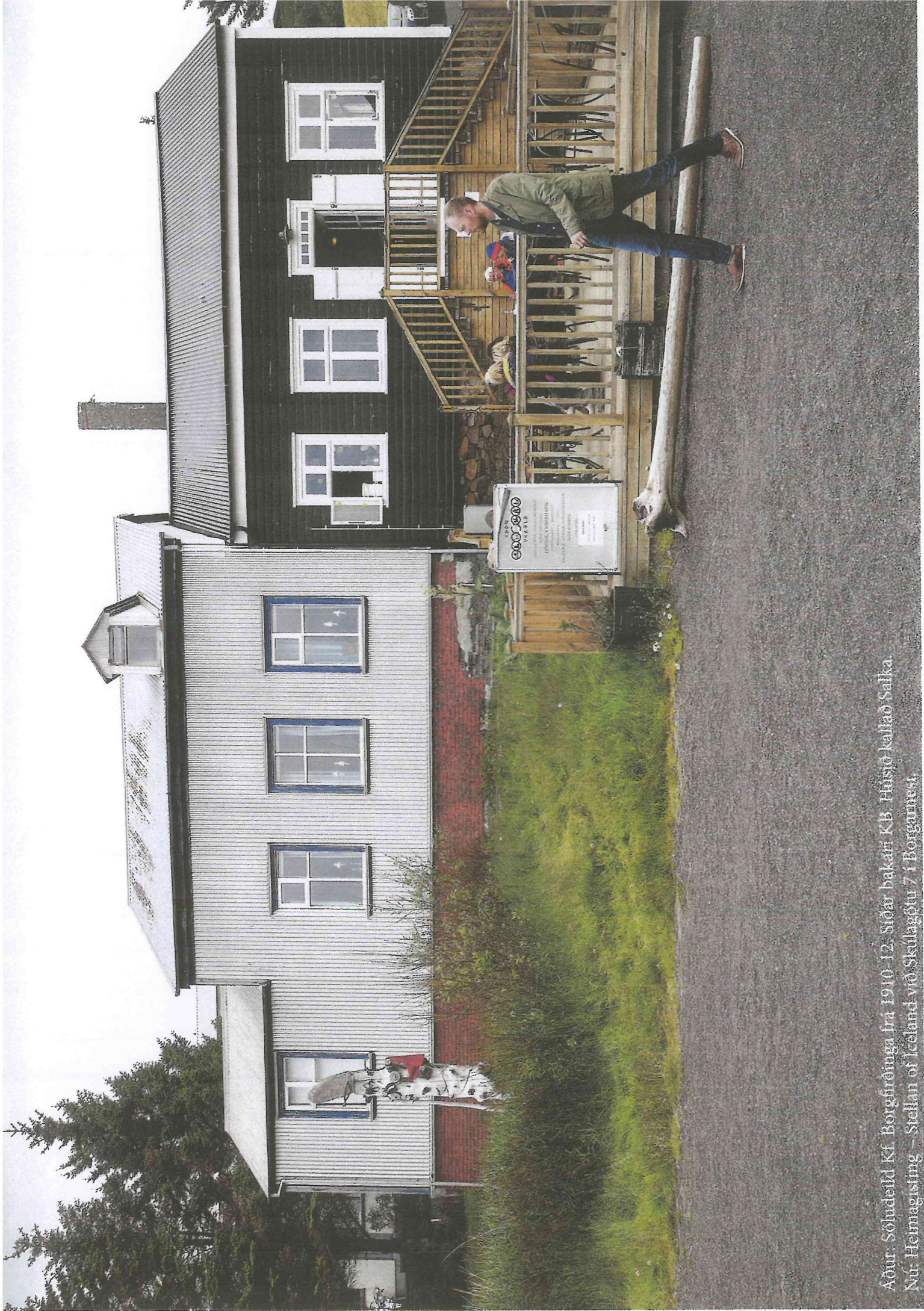
Adur: Söluæfild Kf. Borgfirðinga. Íra 1910-12. Stöðir bakari K.B. Húsið kallað Salka. Nú: Heimnagisting – Stellan of Íceland-við Skúlagötu 7 í Borgarnesi.