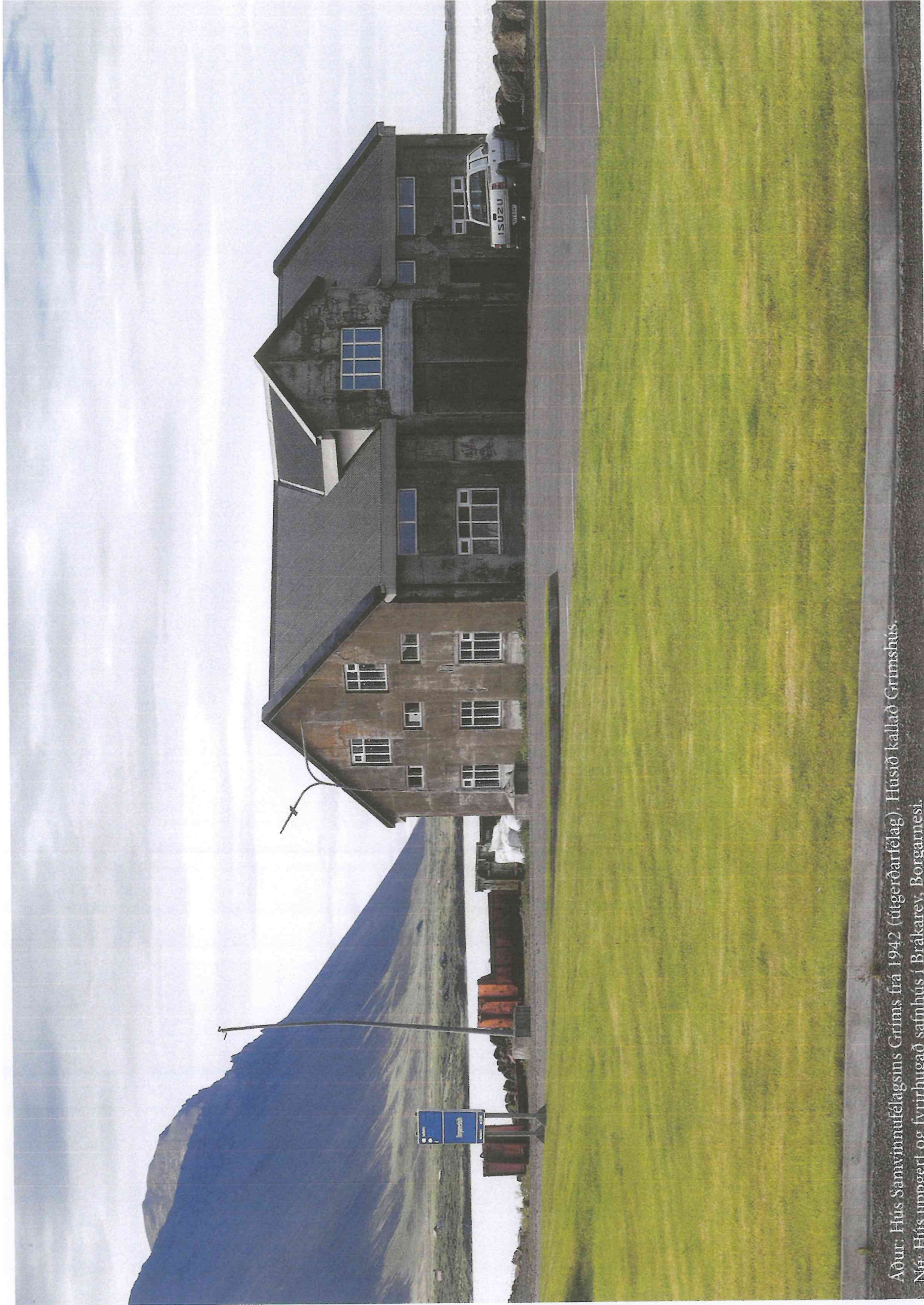
Adur: Hús Samvinnufélagsins Grims frá 1942 (útgerðarfélag). Húsið kallað Grímshús. Nú: Hús umgert og fyrirhugað safnhús í Brákarey, Borgarnesi.