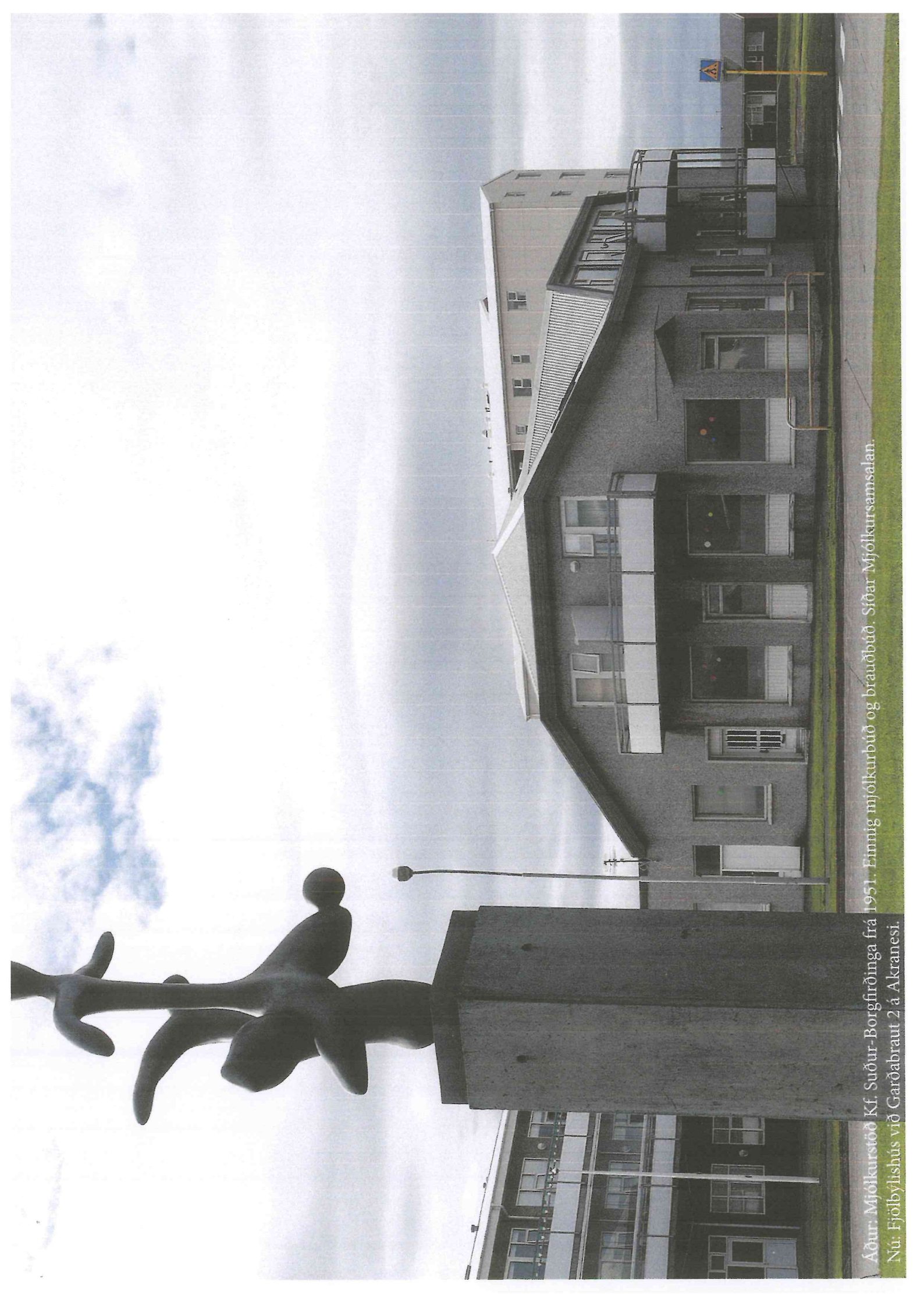
Áður: Mjólkurstöð Kf. Suður-Borgfirðinga frá 1951. Einnig mjólkurbúð og brauðbúð. Síðar Mjólkursamsalan. Nú: Fjölbýlishús við Garðabraut 2 a Akranesi.