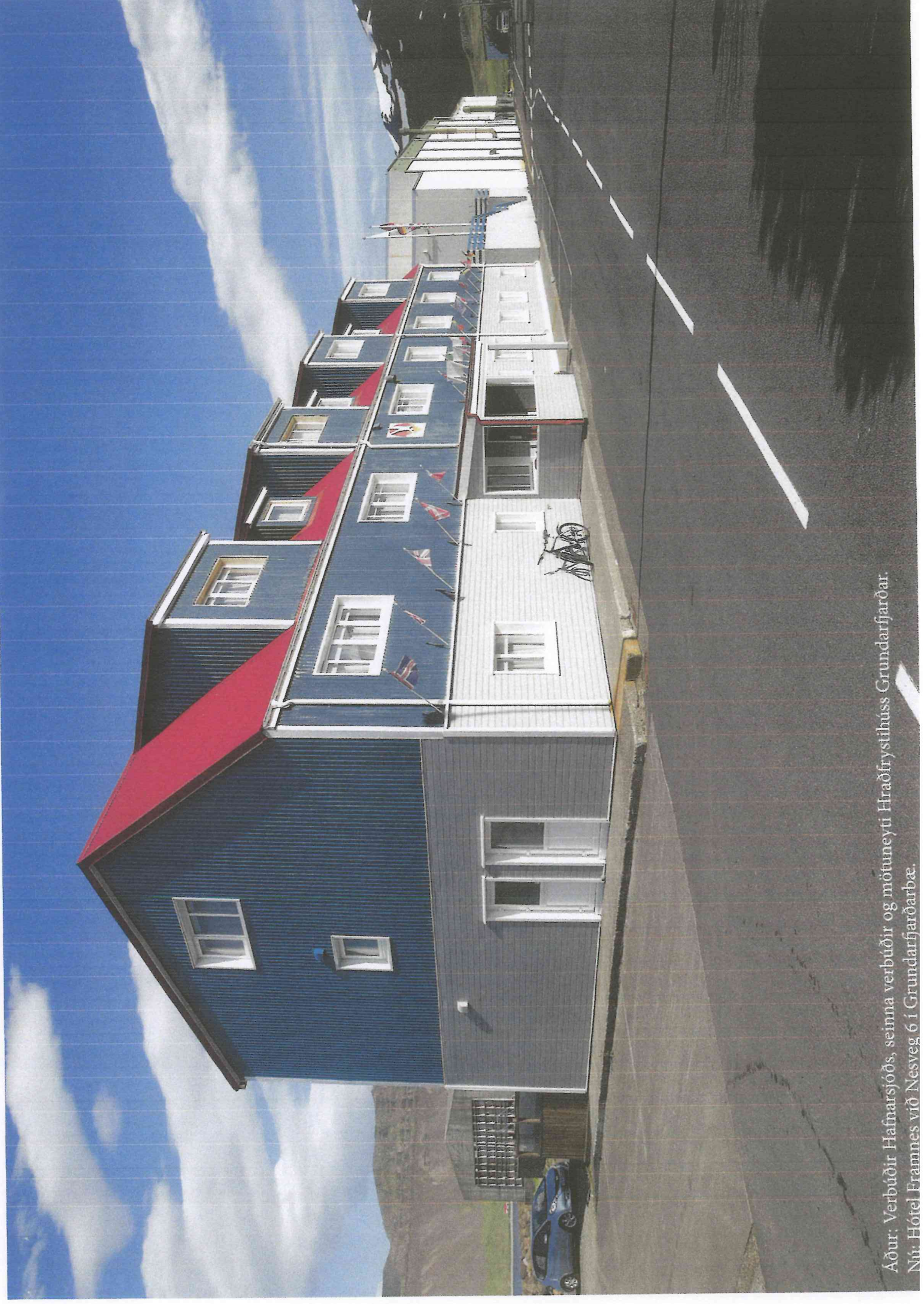
Áður: Verbúðir Hafnarsjóðs, seinna verbúðir og mötumeyi Hraðfrystihúss Grundarfjarðar. Nú: Hótel Framnes við Nésveg 6 í Grundarfjarðarbæ.