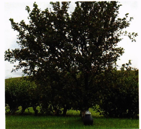
Duftiker við tré. Úr kynningarmyndbandi

Tré lífsins er frumkvöðlaverkefni í þróun og skiptist í þrjú hluta. Fyrsti hlutinn er skráning hinstu óska í persónulegan gagnagrunn, annar hlutinn er rafræn minningasíða og þriðji hlutinn bálstofa og Minningagarðar. Sá hluti sem snýr að handhöfum skipulagsvaldsins eru Minningagarðar. Í Minningagarðana verðuraska látinna einstaklinga gróðursett ásamt tré sem mun vaxa upp til minningar um hinn látna og vera merkt rafrænu minningasíðu þess sem undir því hvílir.