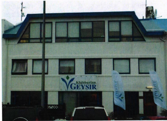
Klúbburinn Geysir Skipholti 29, 105 Reykjavík