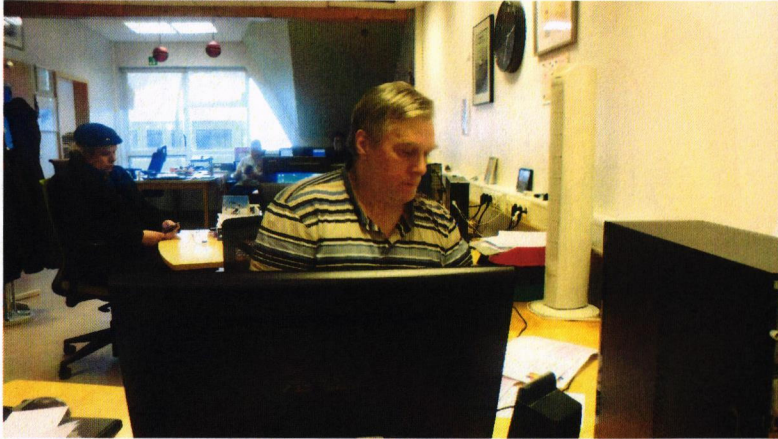
Höfundur við störf í skrifstofudeild

Ég bý í Þorlákshöfn og er mjög ánægður með allan aðbúnað þar, það er stutt í allt og viðmót nágrannanna gott, Ég og eiginkona mín fluttum í Þorlákshöfn í fyrra og erum bara mjög ánægð, á morgnana höfum