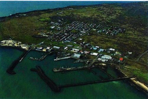
Loftmynd af gæðabyggðinni Þorlákshöfn

við sólrísu og á kvöldin höfum við sólsetur, vegna þess að íbúðin snýr þannig, ég fer stundum út að tína rusl eftir rokin sem oft dynja á bænum. Það er mikil framkvæmdaglegði í fólkinu í Höfninni og lýsislyktin ilmar stundum yfir bæinn,