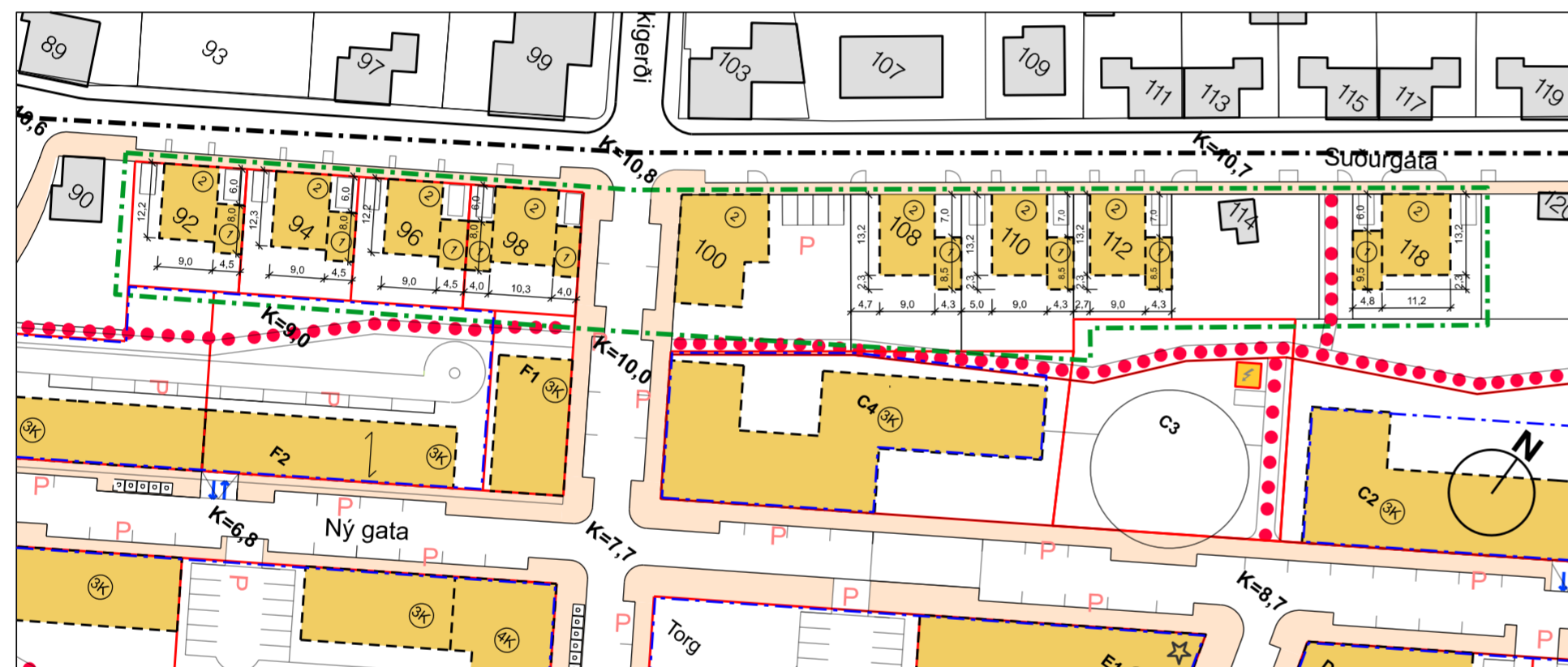
BREYTT DEILISKIPULAGI FYRIR SUÐURGÖTU