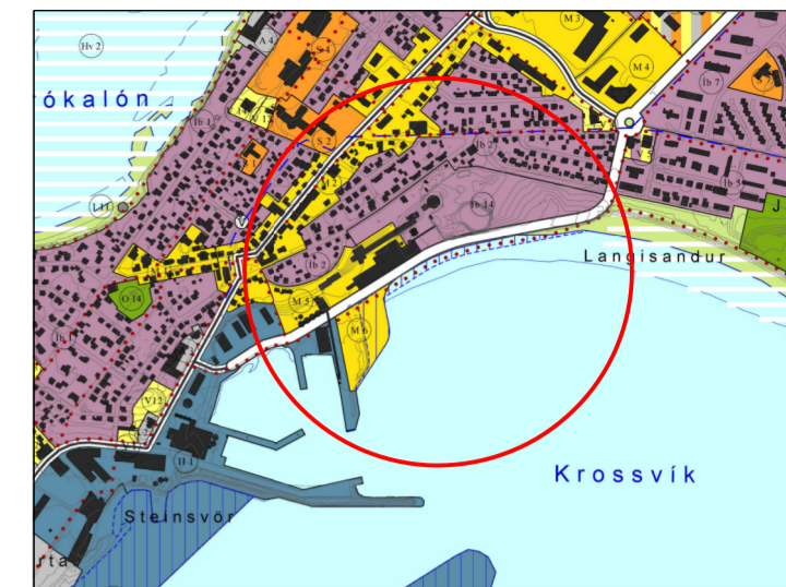
BREYTING Á AÐALSKIPULAGI AKRANESS 2005-2017 FYRIR SEMENTSREIT OG HAFNARSVÆÐI, SAMÞYKKT Í BÆJARSTJÓRN 12.09.2017