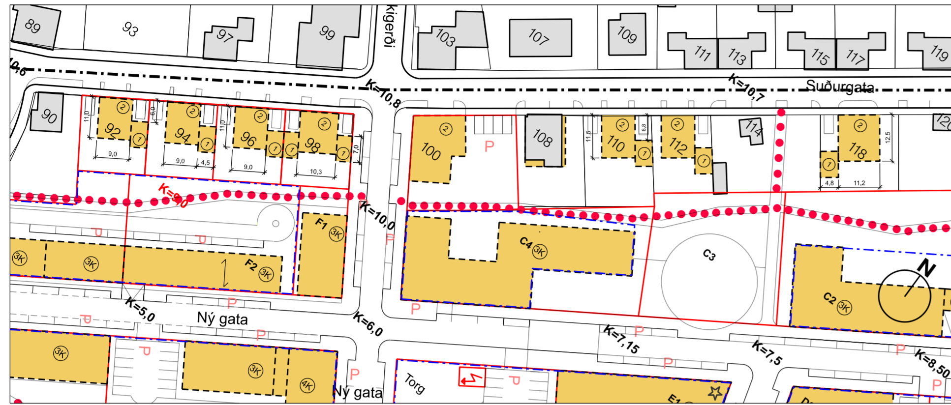
NÚVERANDI DEILISKIPULAGI, samp.28.08.2018

Breytingin nær til staðgreinireita 3000-1-00088404, 3000-1-00088403, 3000-1-00088308, 3000-1-00088307, 3000-1-00088303, 3000-1-00088306, Hafnarsvæði 2 (Nr. 220493) ásamt aðliggjandi lóðum á Suðurgötu og Mánabraut.