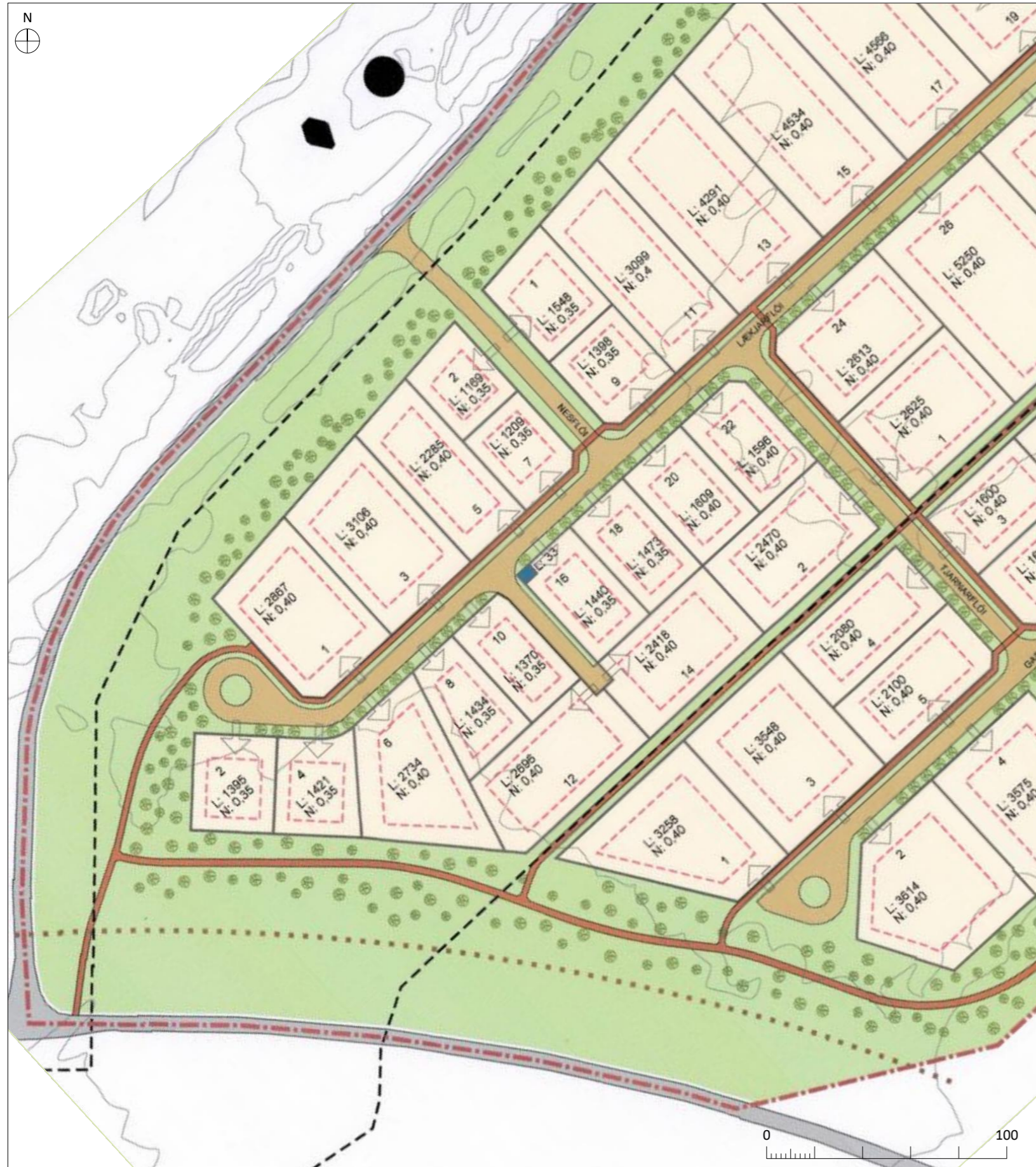
DEILISKIPULAGSBREYTING 2019 1:2000