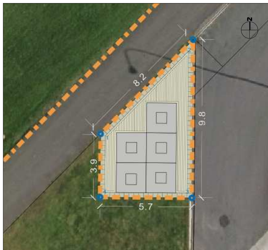
Eftir breytingu, nærmynd. Mkv. 1:200