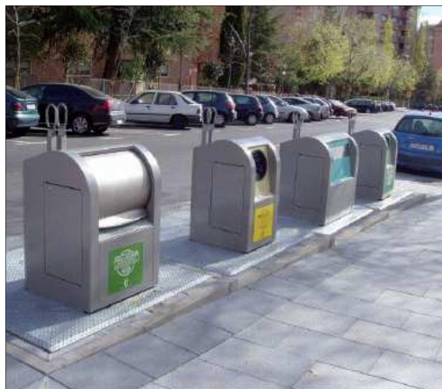
Dæmi um útlit á djúpgámum.