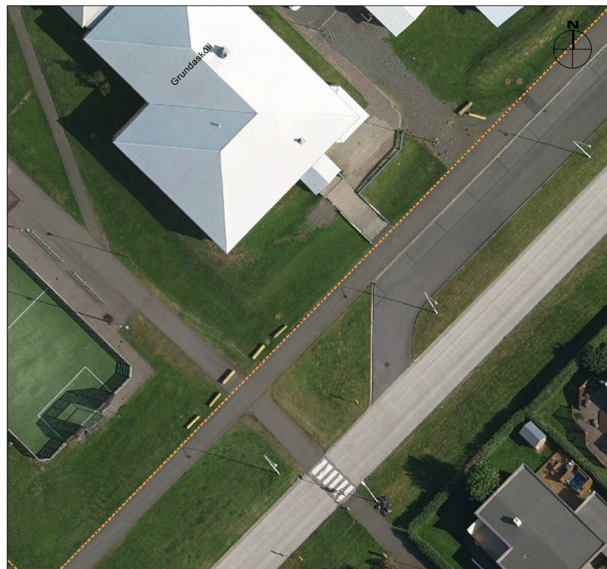
Núverandi aðstæður. Mkv. 1:1000