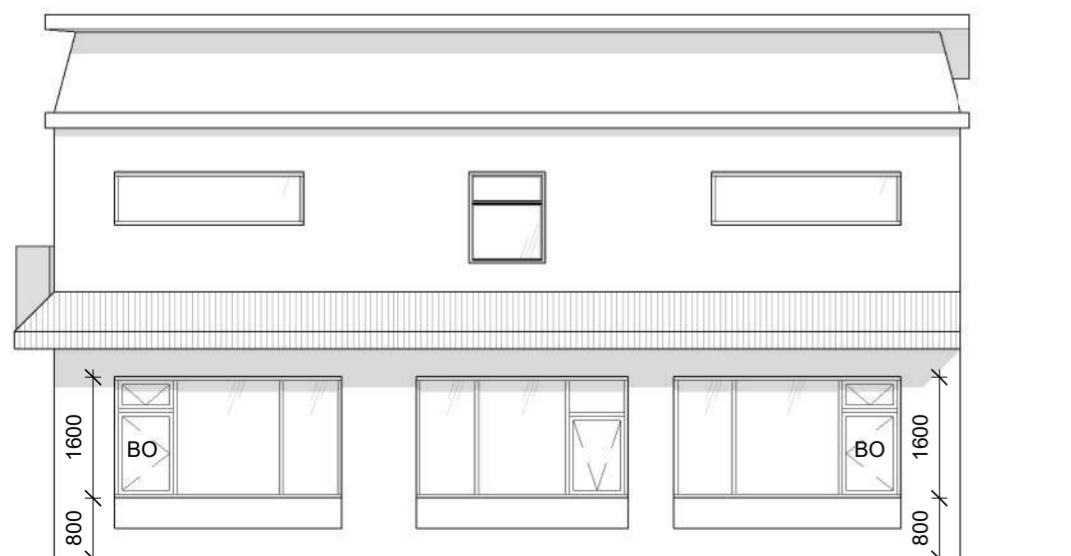
Norðausturhlíð eftir breytingu. 1 : 100