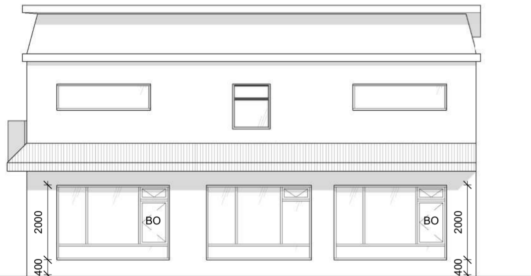
Norðausturhlíð fyrir breytingu. 1 : 100