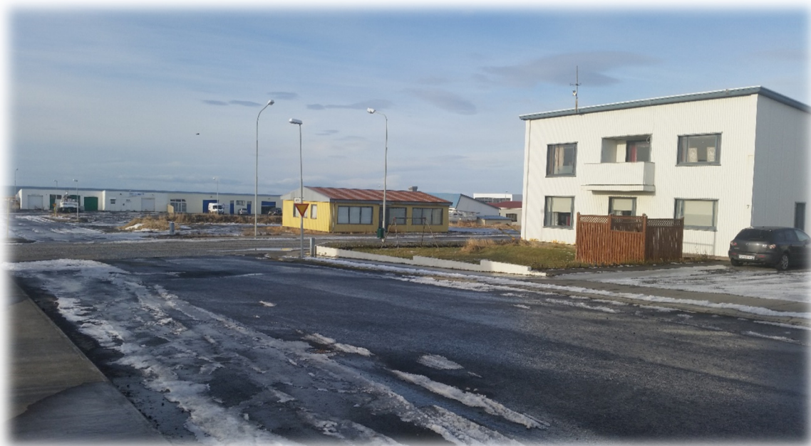
Mynd 1 Séð frá Vallholti í norður (Gula húsið er núverandi húsnæði á lóð).

Skipulagssvæðið er hornlóð á mótum norðan Vallholts og vestan Vesturgötu.