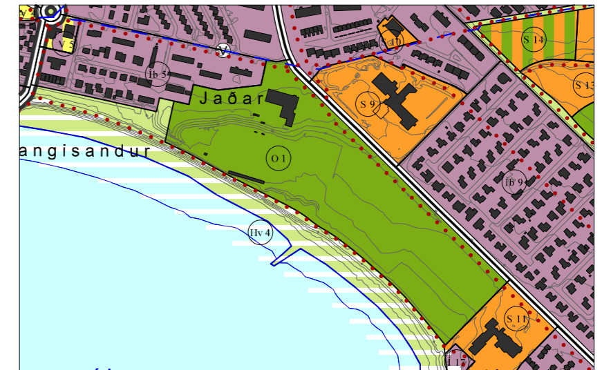
AÐALSKIPULAG AKRANESS 2005-2017, 1:10.000

Deiliskipulag Jaðarsbakka var samþykkt í bæjarstjórn Akraness 13. desember 2005. Nokkrar breytingar hafa verið gerðar á deiliskipulaginu síðan og á ein þeirra við þann hluta þess, sem hér er fjallað um, þ.e. stækkun byggingarreits áhorfendastúku.