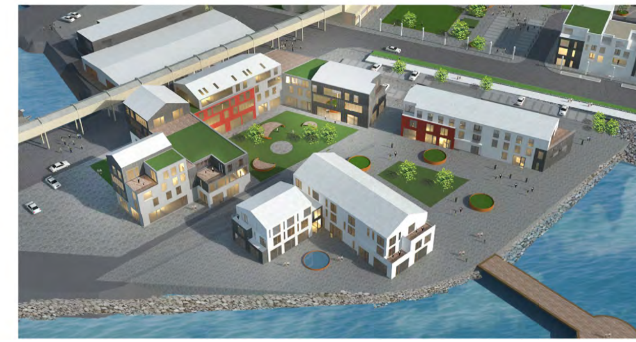
Reitur I - J