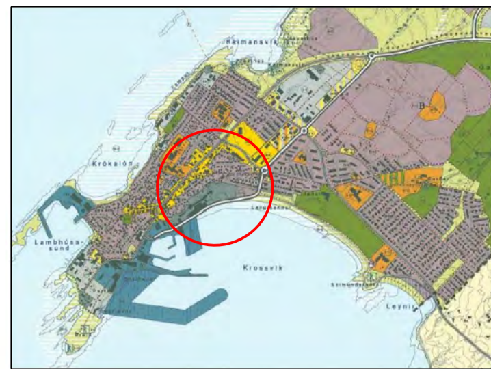
ADALSKIPLAG AKUREYRI 2005-2017