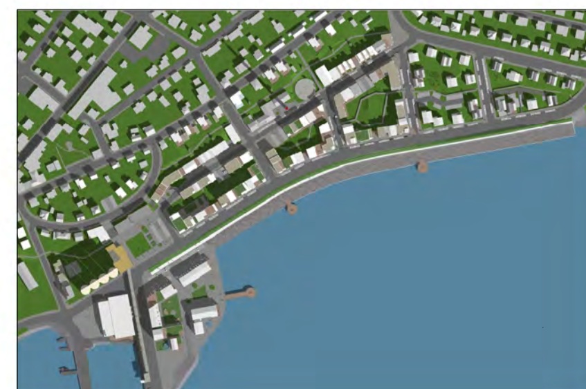
Skuggavarp 21. mars kl. 10