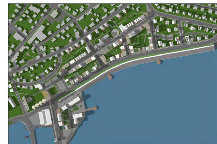
Skuggavarp 21. mars kl. 17

ASK ARKITEKTAR EHF GÖRSÓTTU 9 101 REYKJANÚK SMÍ 515 0300 FAX 515 0319 www.ask.is