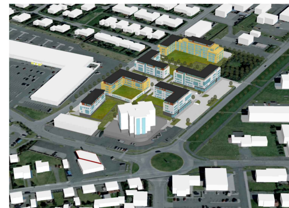
Yfirlitsmynd, horft úr suðvestri