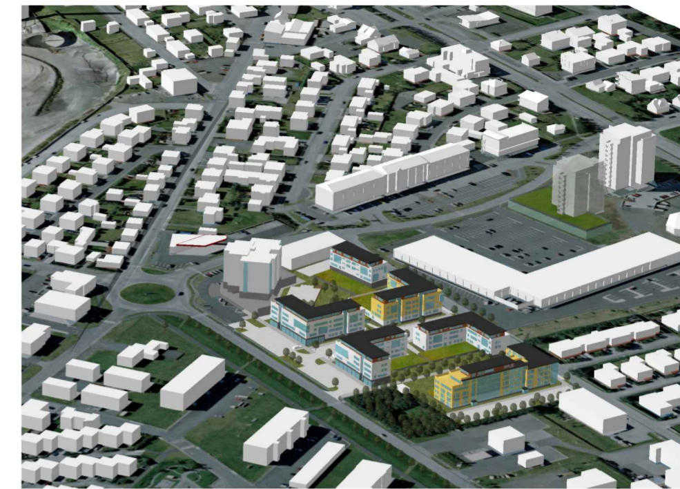
Yfirlitsmynd, horft úr norðaustri