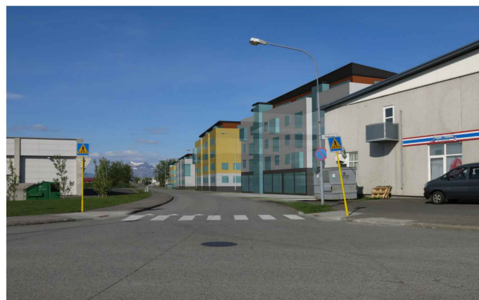
Horft norður Dalbraut