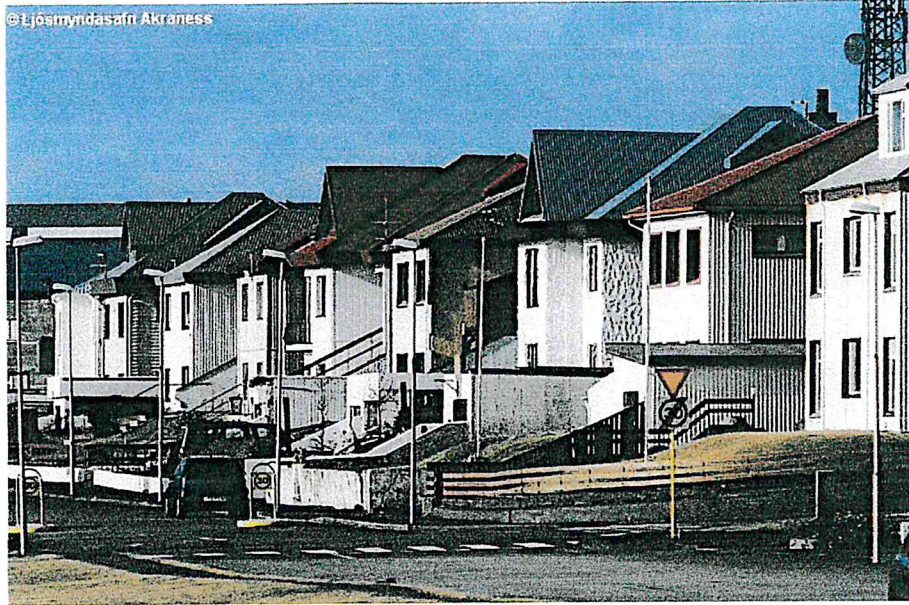
Húsin við Jaðarsbraut