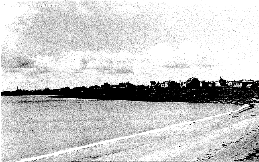
Langisandur sem yrði endurheimtur og bæjarmynd Skagans áður en Sementsverksmiðjan reis