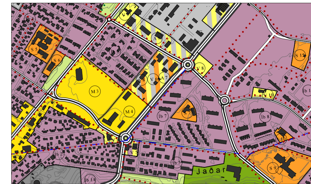
Aðalskipulag Akraness 2005-2017 m.s.br. mkv. 1:10.000