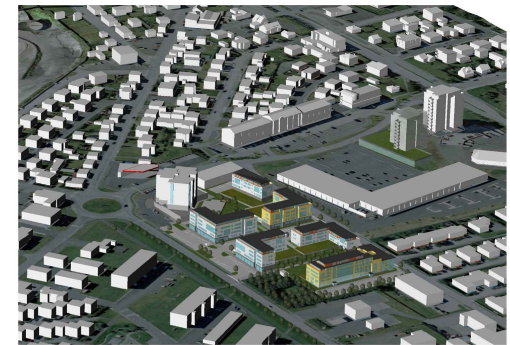
Yfirlitsmynd, horft úr norðaustri

Skýringarmyndir eru teknar af einföldu landmódeli. Þær sýna dæmi um stærð og rúmtak en ekki endanlegt útlit eða hönnun. Einnig sýna þær þá rýmismyndun og bæjarmynd sem felst í skipulagstillögunni – með þeim fyrirvara að húsin eru óhönnuð og munu örugglega líta öðru vísi út.