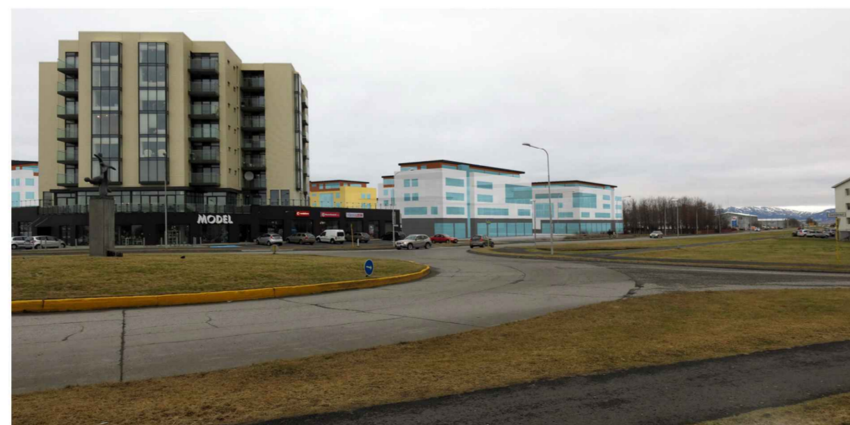
Horft norður Þjóðbraut