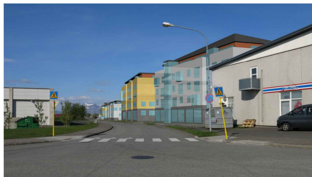
Horft norður Dalbraut