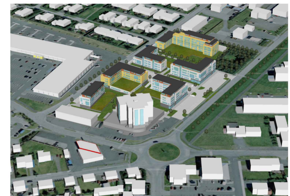
Yfirlitsmynd, horft úr suðvestri