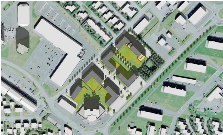
21. apríl/ágúst kl. 13.30, hádegi