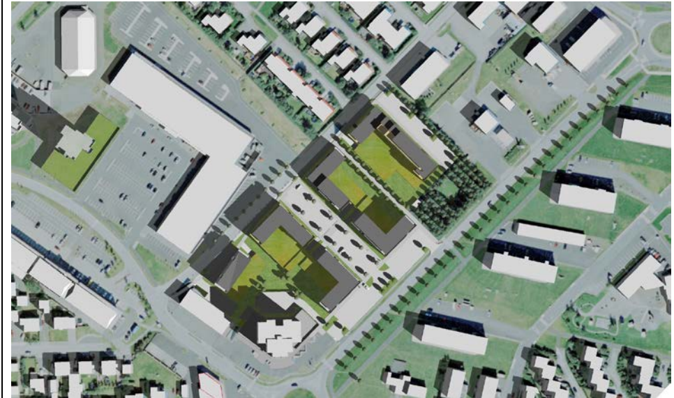
21. apríl/ágúst kl. 10.30