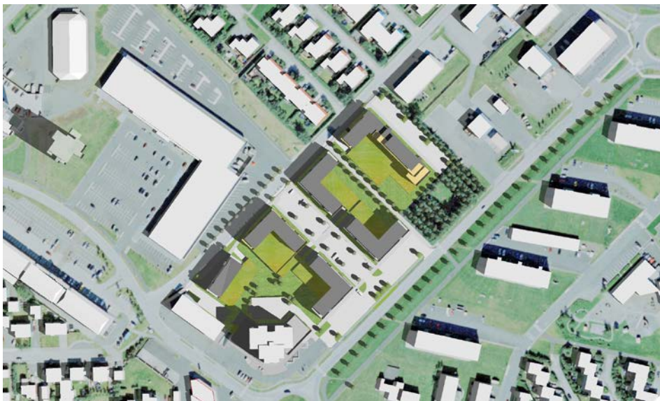
21. júní kl. 10.30