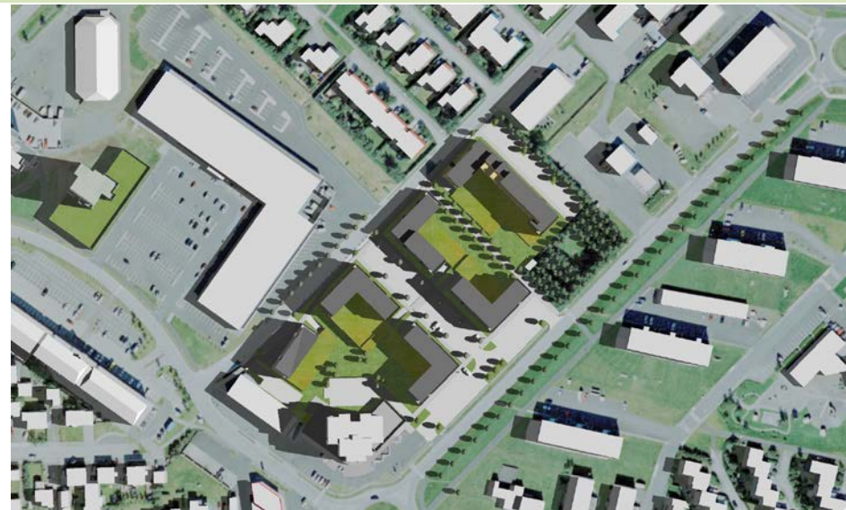
21. júní kl. 9