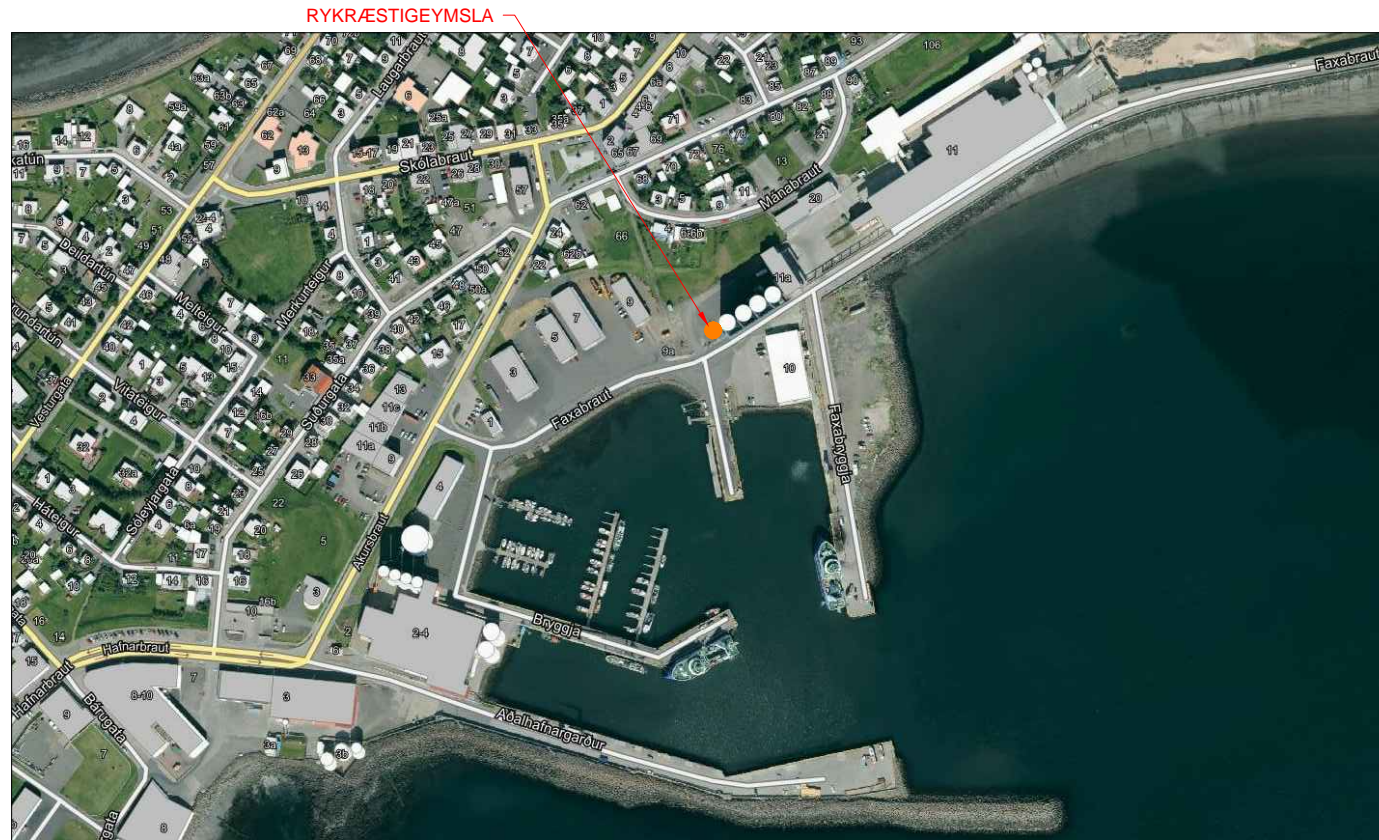
Loftmynd ekki í skala

SKÝRINGAR Rykræstivirki: Tilgangur með uppsetningu rykræstivirkis, húss og búnaðar er að draga úr rykálagi á svæðinu og minnka hávaða sem berst frá bygðarstöðinni, og auka öryggi þar sem búnaður verður innbyggður. Þvottaplan: Tilgangurinn með uppsetningu þvottaplans er að draga úr rykálagi og bæta ásýnd farartækja.