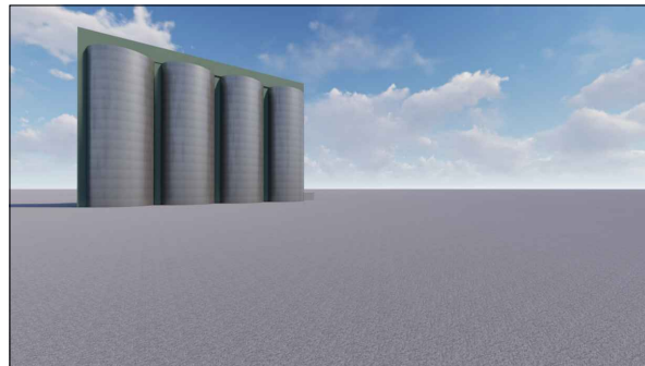
3D Ásýndir fyrir breytingar

Að loknum lóðarleigusamningi 1. ágúst 2028 mun Sementsverksmiðjan ehf. rífa þessi nýju mannvirki á sinn kostnað.