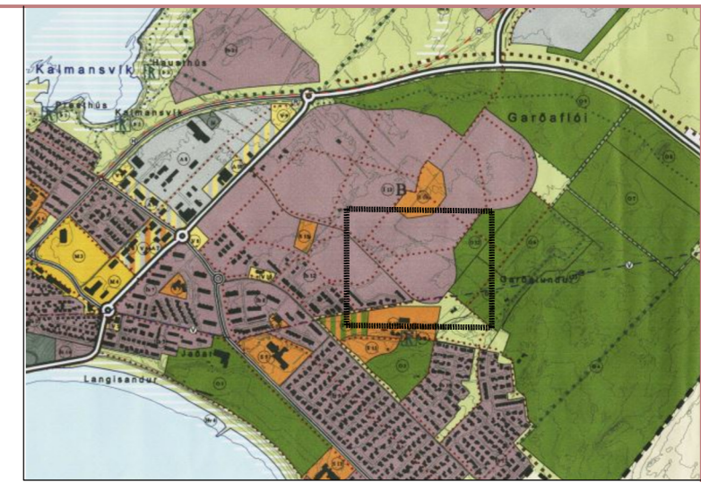
Hluti Aðalskipulags Akranes 2005-2017

Deiliskipulagsbreyting þessi nær eingöngu til lóðarinnar Baugalundar 3. Breytingin fellst í því að færa bílastæði og bundna byggingarlínu frá suðvesturhorni lóðarinnar til suðausturhorns í samræmi við lóðina Baugalund 5.