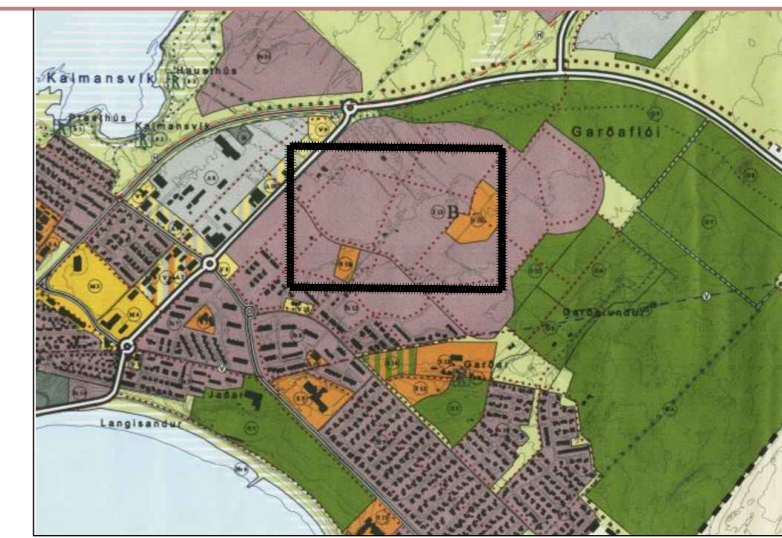
Hluti Aðalskipulags Akraness 2005-2017

Gildistaka breytingarinnar var auglýst í B-deild Stjórnartíðinda þann _____ 2018.