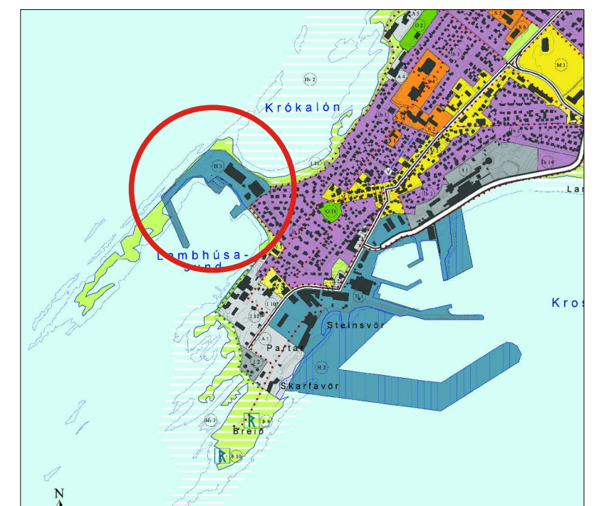
Hluti úr aðalskipulagi Akraness 2005-2017 (ekki í kvarða)