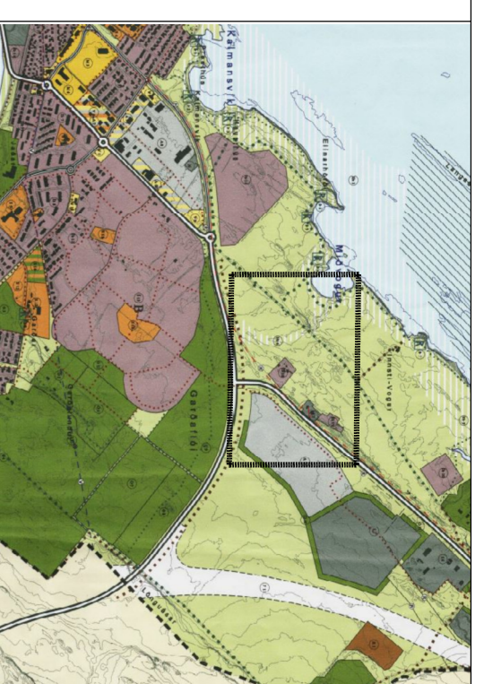
Húli Aðskilningur Akranesi 2005-2017

ANNAÐ Allir kosnabur sem af delískipulagsþryggingunum. heitlólóða, er á kosnabú eiginandi lóða.