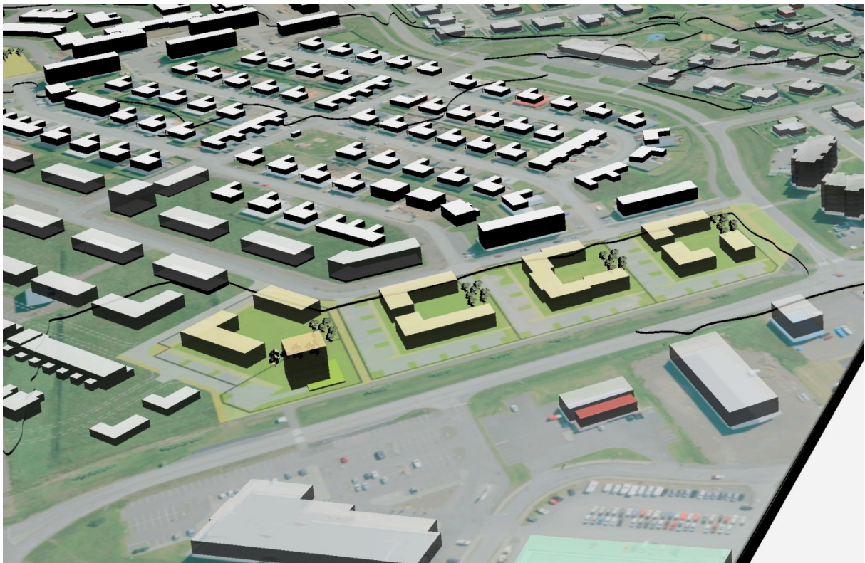
Mynd 2. Einfalt landmódel. 4. áfangi Skógahverfis fremst á myndinni austan Þjóðbrautar. Einföld dæmi um grunnform bygginga.

Ákvæði um vegg hæð og mænishæð tveggja hæða fjölbýlishúsa gefa kost á nýtingu rishæðar sem þá verður efri hæð íbúða á 2. hæð. Lausnin gefur t.d. kost á að hafa stórar tveggja hæða fjölskylduíbúðir á efri hæðum en smáíbúðir á jarðhæð. Með inngangi á jarðhæð fyrir efri hæðir, sérinngangi eða sameiginlegan fyrir tvær íbúðir, má gera ráð fyrir útgangi í garð og hjóla- og vagnageymslu undir stiga á jarðhæð.