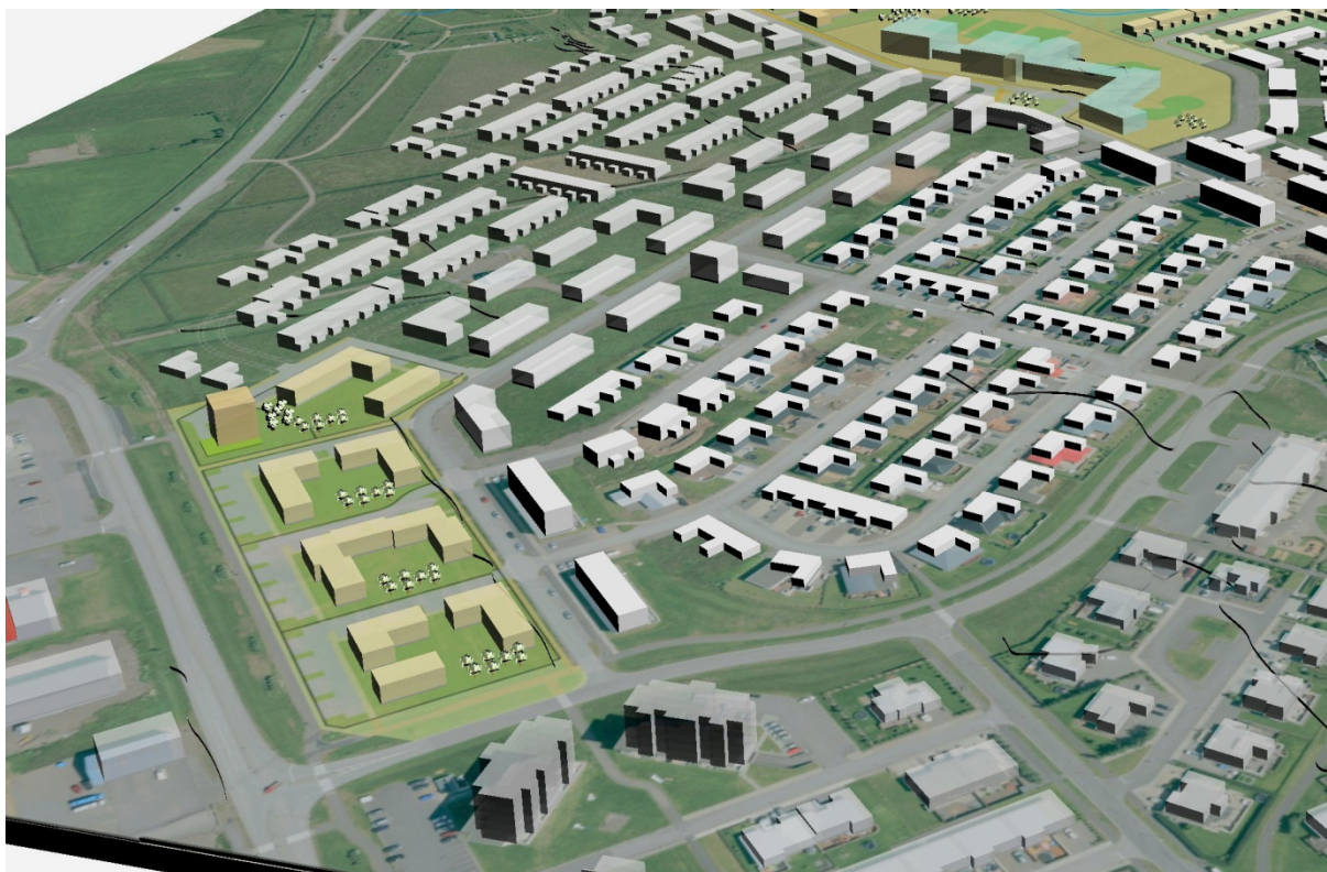
Mynd 1. Einfalt landmódel. Skógahverfi – 4. áfangi til vinstri. Dæmi um grunnform bygginga.

Skipulagsuppdráttur dagsettur 18.10.2019 er hluti deiliskipulagsins.