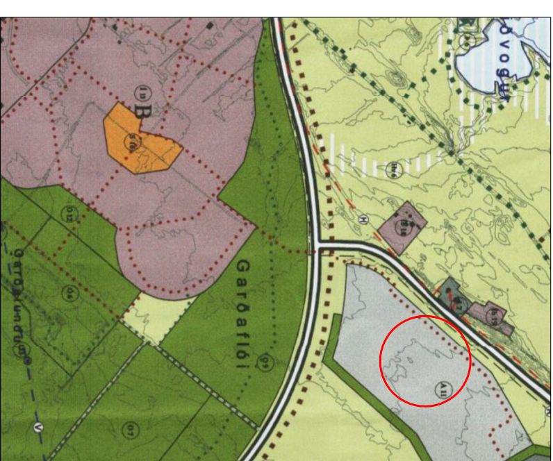
Hluti af aðalskipulagssupplærði Akranes 2005-2017 Rauður hringur sýnir hvar Lækjarflói er

AFGREIÐSLA SKIPULAGSINS Deiliskipulag þetta sem fengið hefur meðferð samkvæmt ákvæðum 3. mgr. 44. gr. skipulagslaga nr. 123/2010, var samþykkt í bæjarstjórn Akraness þann