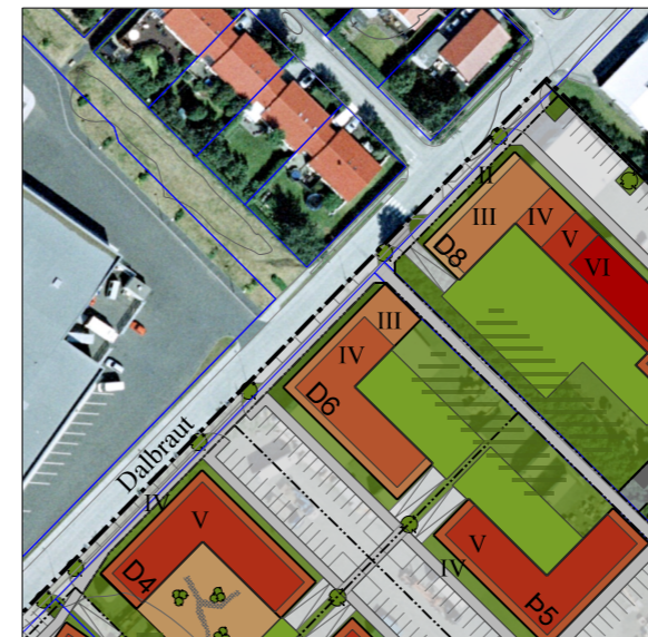
Skýringarmynd, breytt skipulag