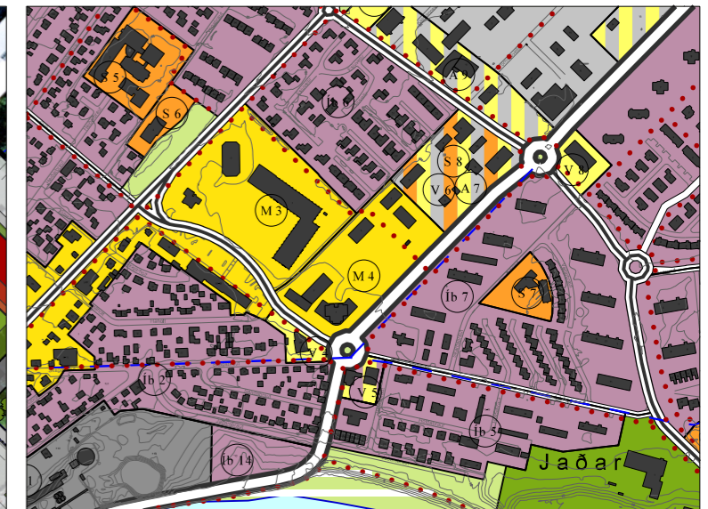
Aðalskipulag Akraness 2005-2017