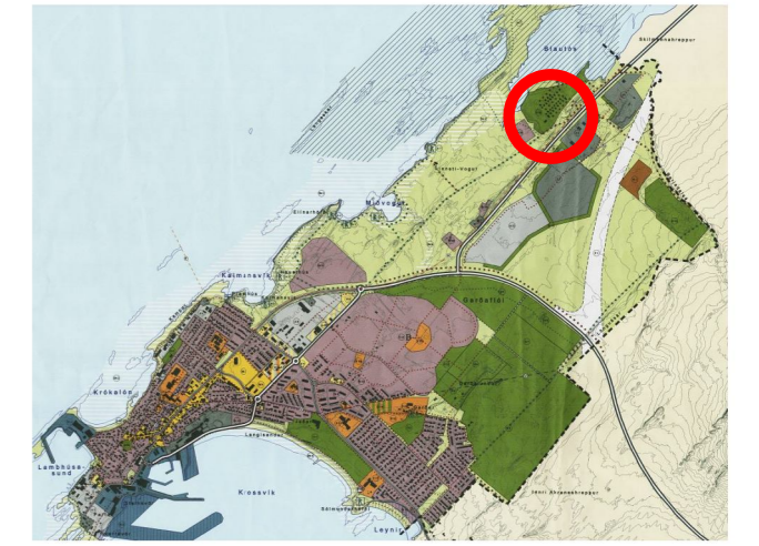
AÐALSKIPULAG AKRANESS 2005-2017, ekki í skala

GREINARGERÐ: Breyting: Um er að ræða deiliskipulagsbreytingu á lóðinni Æðaroddi 40, Akranesi. Breytingin felur í sér að byggingarreitur fyrir húsið Æðaroddi 40 verði færður og snúið nær götunni eða í 1,5 m fjarlægð frá götu til norðurs og 3,0 m frá lóðarmörkum til austurs. Byggingamagn á lóð verður óbreytt. Lóðamörk verða óbreytt.