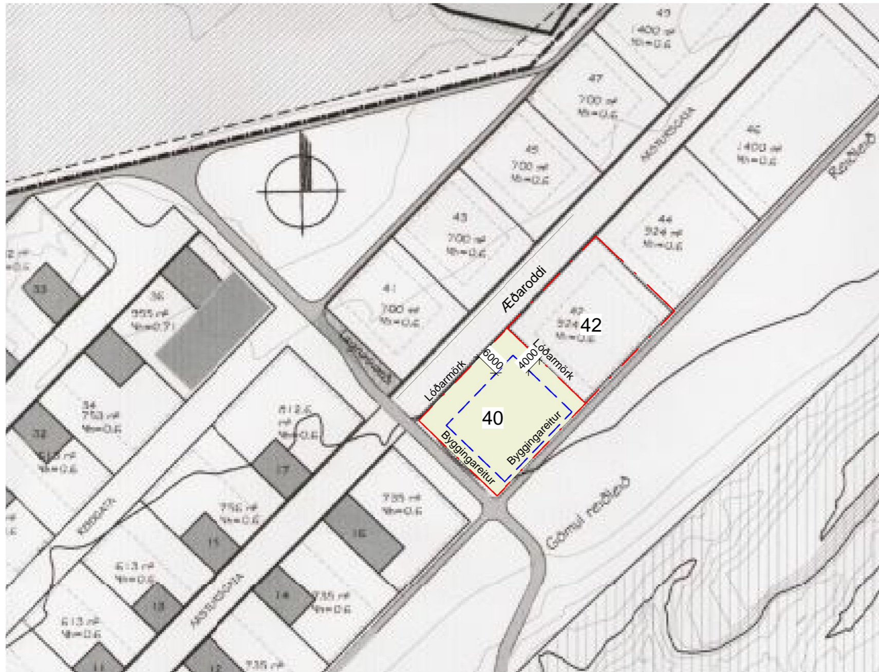
GILDANDI DEILISKIPULAG 1 : 1000