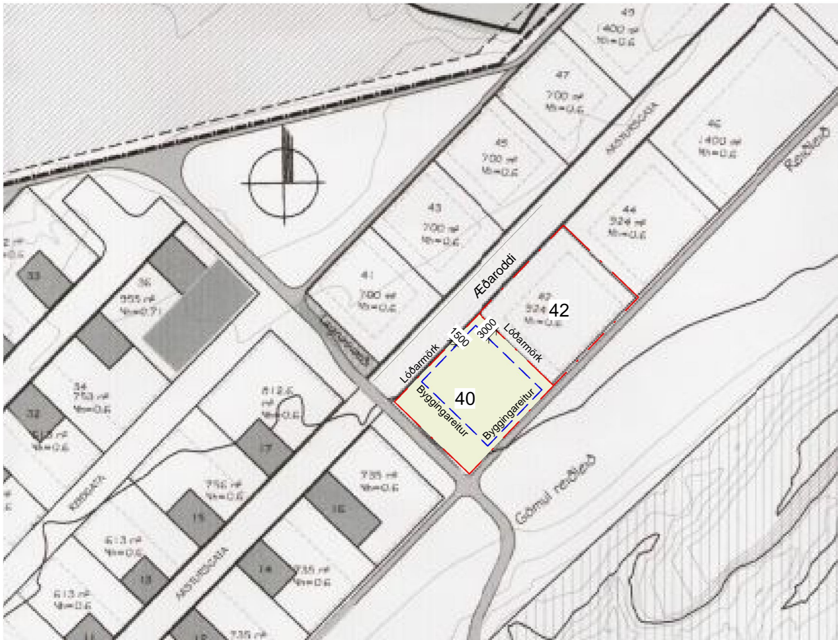
BREYTT DEILISKIPULAG 1 : 1000