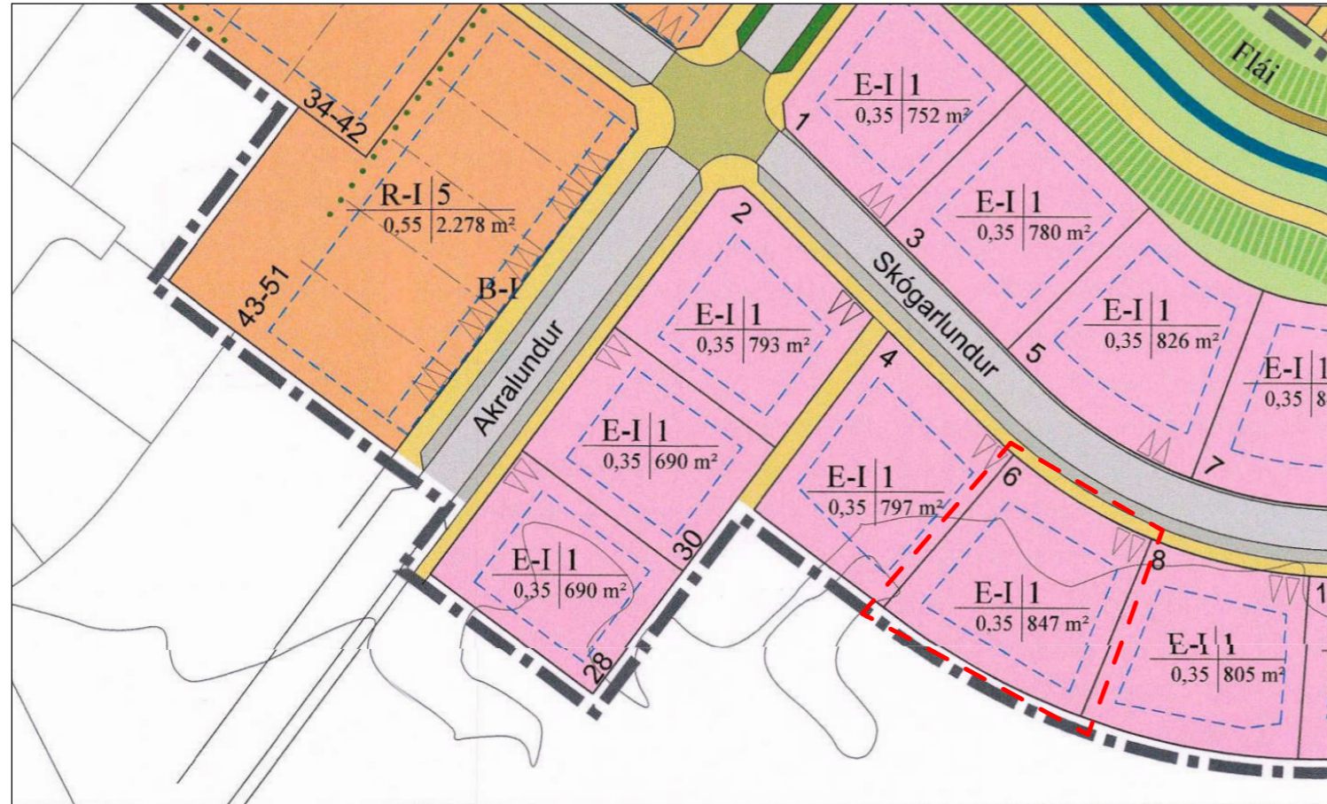
GILDANDI SKIPULAG 1 : 1000