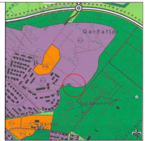
HLUTI AÐALSKIPULAGS AKRANESS 2005 - 2017

Deiliskipulagsbreyting þessi, sem grendarkynnt hefur verið, skv. 2. mgr. 43. gr skipulagslaga nr. 123/2010 var samþykkt í bæjarstjórn