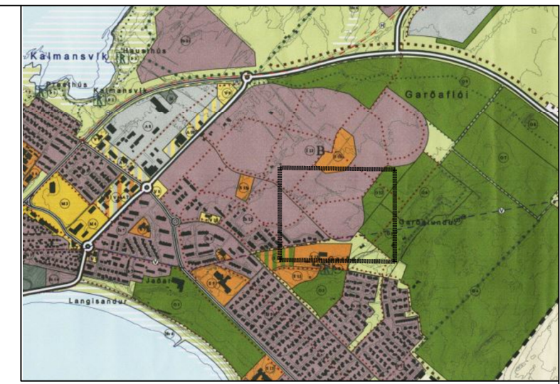
Hluti Aðalskipulags Akranes 2005-2017

Deiliskipulagsbreyting þessi nær eingöngu til lóðarinnar Baugalundar 24. Breytingin fellst í því að færa byggingarreit út um 1,40m í austurátt að opnu svæði sem þar er fyrir framan lóðina (sjá mynd). Við þetta er byggingarreitur að stækka sem þessu nemur. Baugalundur er í bogadreginni götulinu og er þetta ekki að trufla að það fari út úr línu miðað við önnur hús á svæðinu. Einnig verður nýtingarhlutfalli lóðar breitt úr 0,35 í 0,40 vegna þessara lóðar.