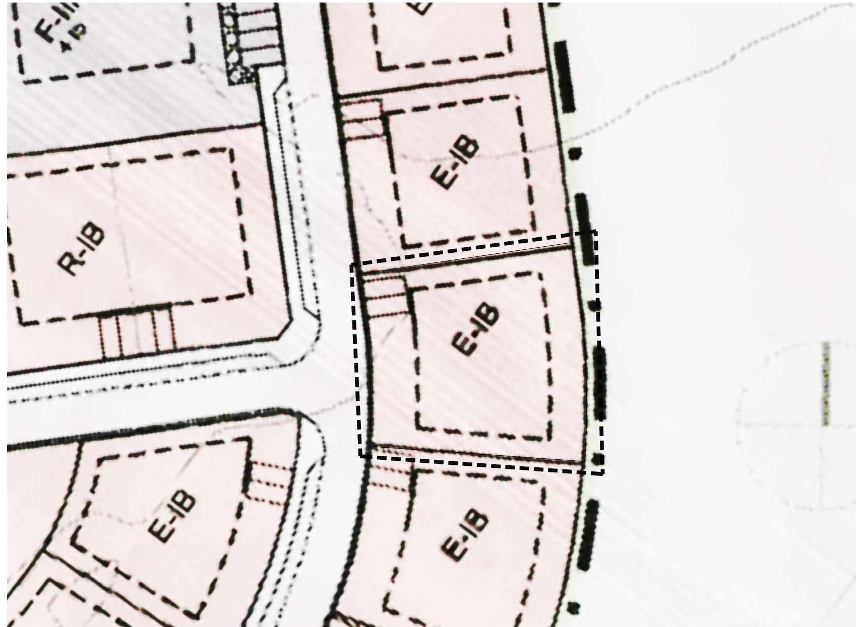
HLUTI AF GILDANDI DEILISKIPULAGI - SKÓGARHVERFI AKRANESI, DEILISKIPULAG 2. ÁFANGA Mkv 1:500 Skipulag samþykkt í bæjarstjórn Akranes í apríl 2007