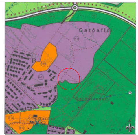
HLUTI AÐALSKIPULAGS AKRANESS 2005 - 2017

Deiliskipulagsbreyting þessi, sem grendarkynnt hefur verið, skv. 2. mgr. 43. gr skipulagslaga nr. 123/2010 var samþykkt í bæjarstjórn