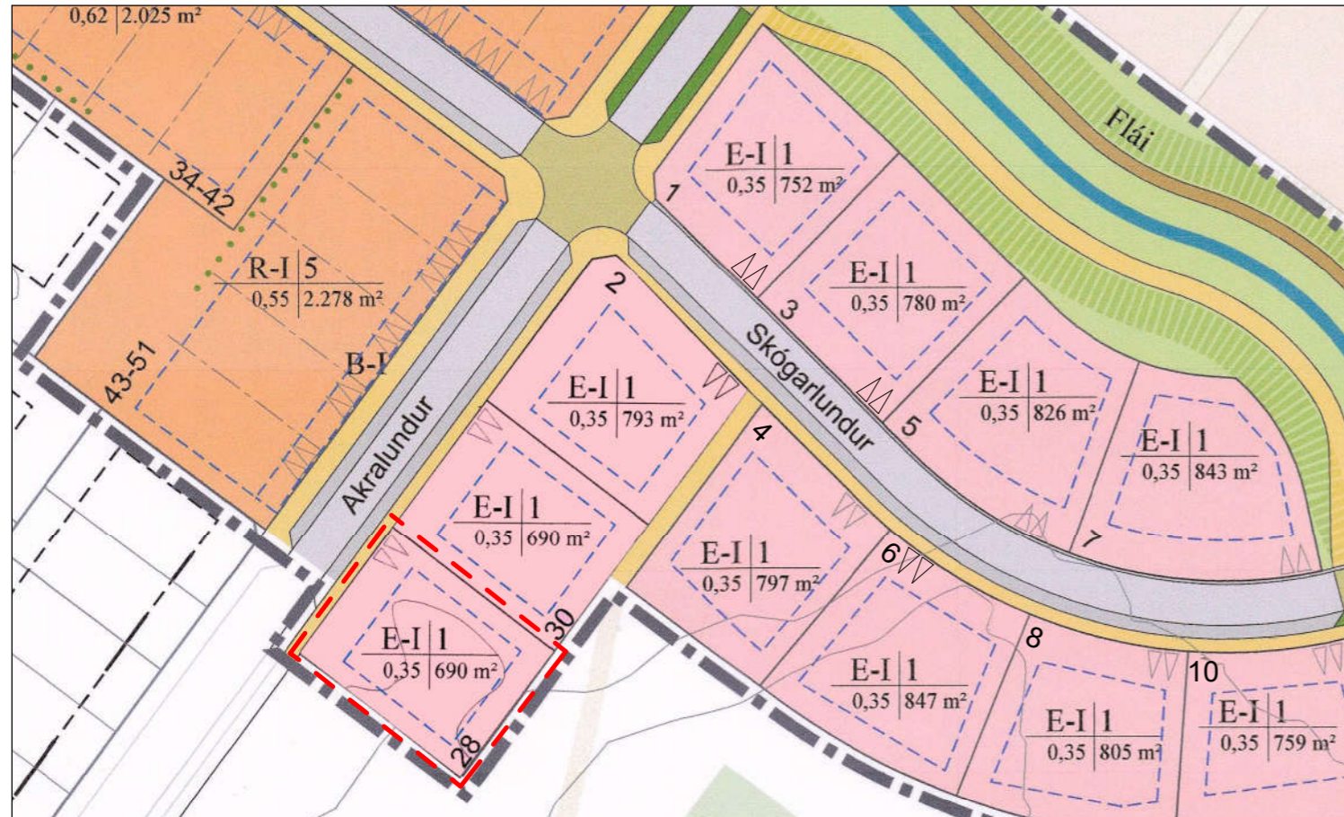
GILDANDI SKIPULAG 1 : 1000