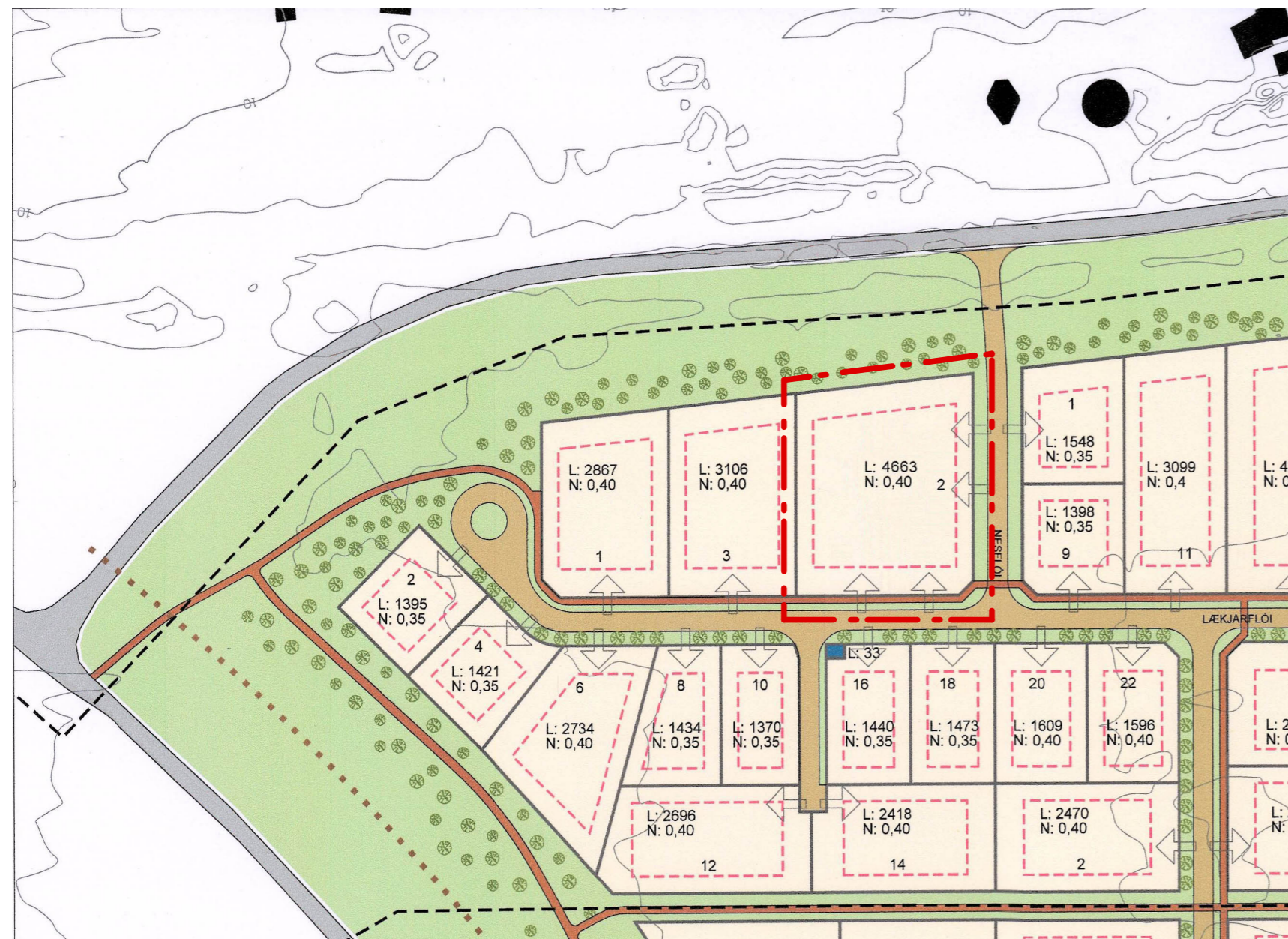
Breytt deiliskipulag, mkv. 1.2000