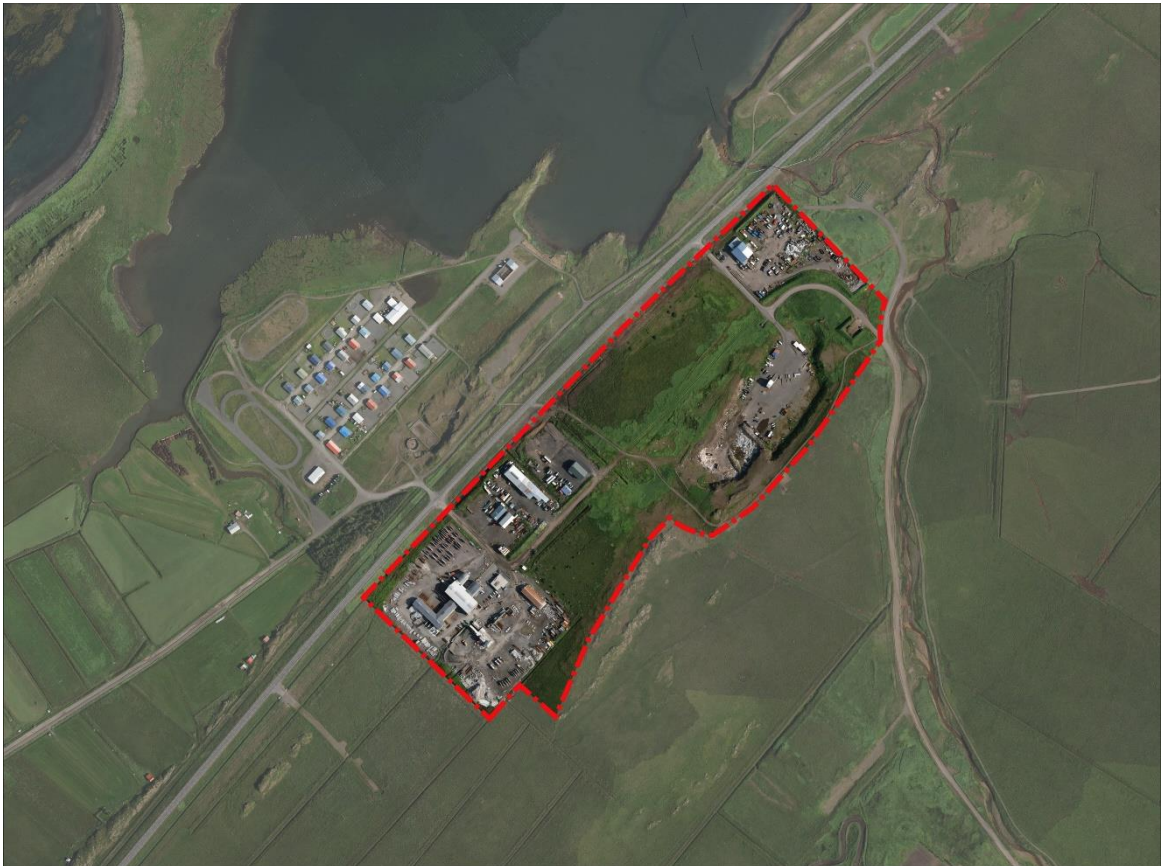
Mynd 1: Skipulagssvæði Höfðasels, 21,5 hektarar .

Með framlagningu lýsingarinnar hefst samráð um gerð skipulagsins. Óskað er eftir því að lóðarhafar og rekstaraðilar á skipulagssvæðinu, umsagnaraðilar, bæjarbúar og aðrir hagsmunaaðilar leggi fram sjónarmið og ábendingar nú í upphafi verks, sem að gagni gætu komið í skipulagsvinnunni.