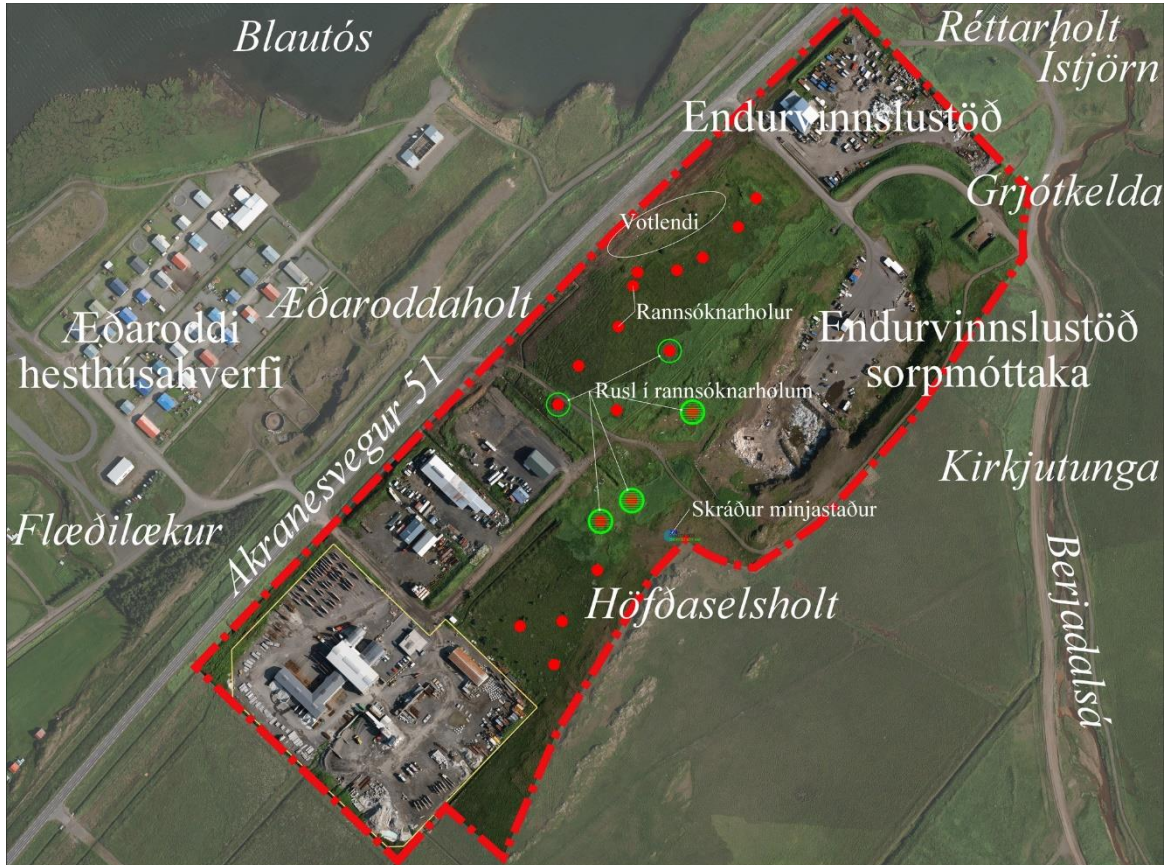
Mynd 2: Jarðvegskönnun. Rauðir punktar sýna allar rannsóknarholur. Grænir hringir eru utan um holur þar sem mikið rusl er undir yfirborði og grenni hringir utan um holur þar sem lítið rusl er undir yfirborði. Ekkert rusl er í öðrum holum.

Á miðhluta svæðisins eru uppgræddir gamlir öskuhaugar. Jarðvegur þar hefur verið kannaður með borun rannsóknarhola.