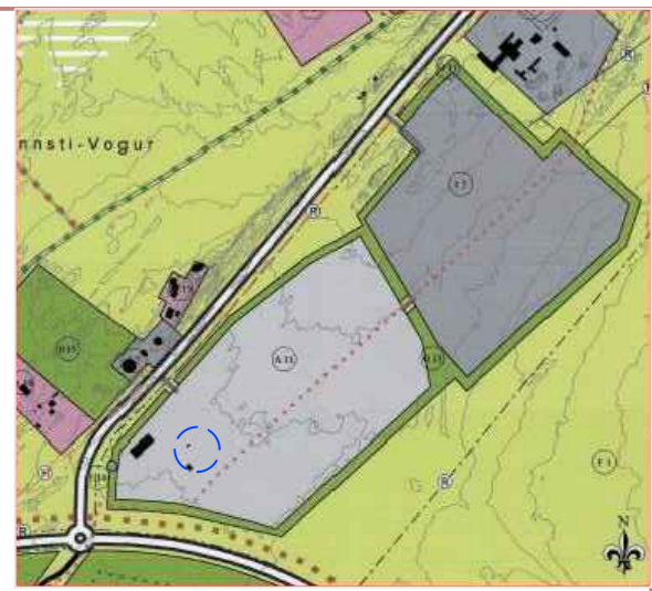
Hluti Aðalskipulags Akraness 2021-2033

HLUTI AF GILDANDI DEILISKIPULAGI - FLÓAHVERFI AKRANESI, DEILISKIPULAG Mkv 1:500 Skipulag auglýst í B. deild 1. 8. 2019