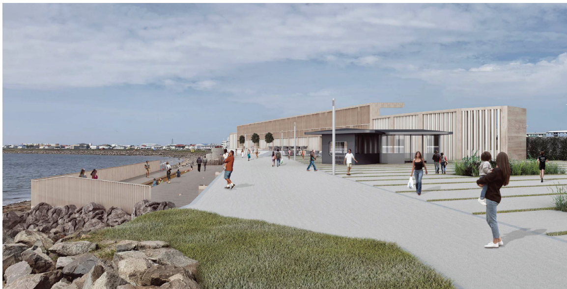
Mynd 4: Skýringarmynd úr verðlaunatillögu.

Dómnefnd þótti áberandi að allar tillögurnar væru unnar í takt við leiðarljós og markmið samkeppninnar. Eftirtektarvert var að skoða allar tillögurnar samhliða og sjá hvað þær voru ólíkar og allar metnaðarfullar. Langisandur er svæði sem er í eigu íbúa á Akranesi og er það einlægur vilji Akraneskaupstaðar að halda áfram uppbyggingu á því svæði í sátt og samlyndi íbúa og náttúru. Hugmyndir tveggja teyma um þéttingu byggðar voru helst til of miklar en dómnefnd var sammála um að slík uppbygging væri álitlegur valkostur og þyrfti að útfæra betur með framangreind atriði í huga.