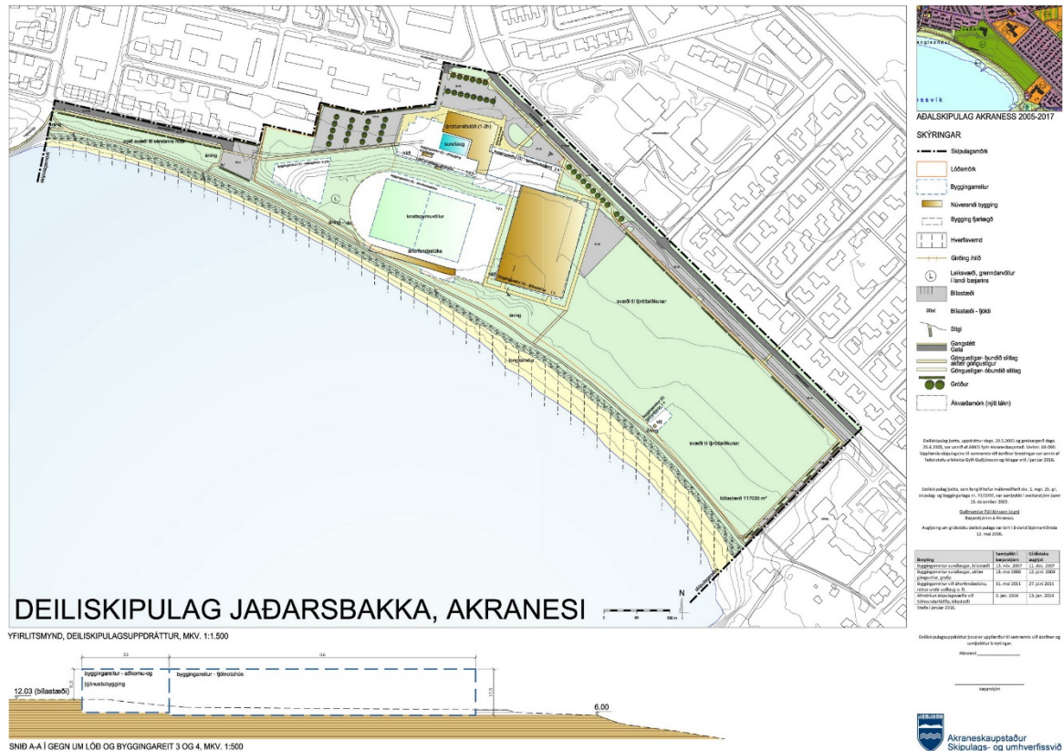
Mynd 3: Deiliskipulag Jaðarsbakka.

Ekkert deiliskipulag hefur verið gert fyrir landnotkunarreit ÍB-203 en hluti þess er innan skipulagssvæðisins sem skipulagslýsingin nær til.