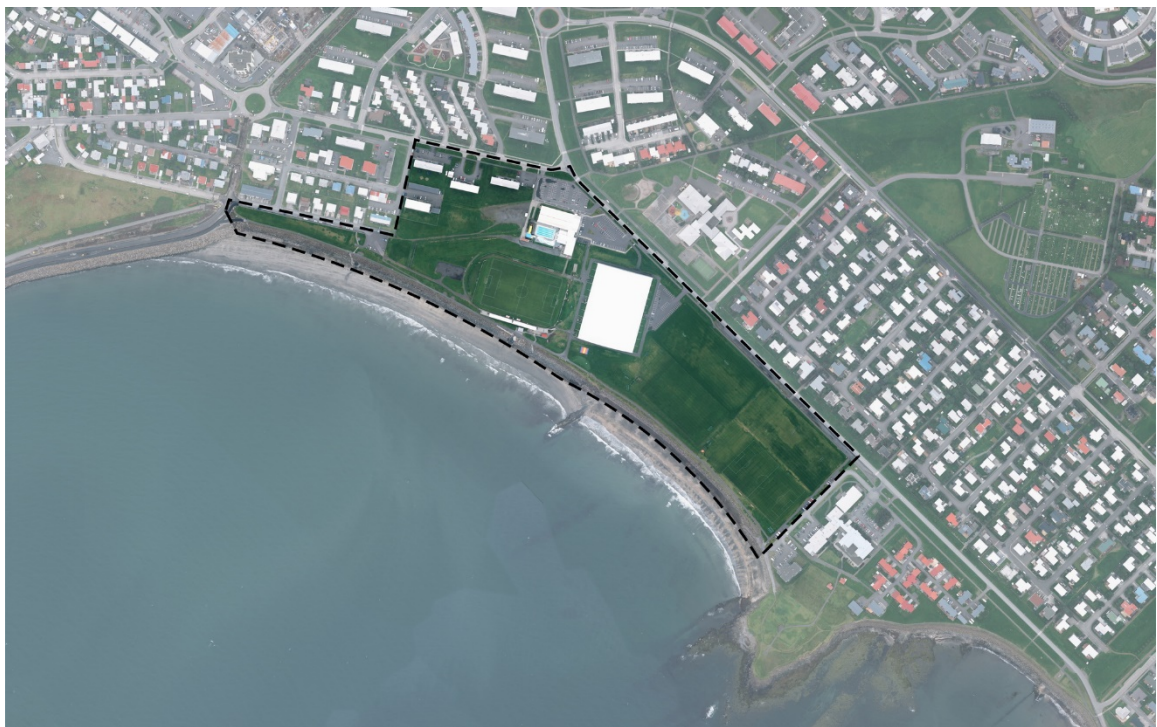
Mynd 1: Skipulagssvæðið.