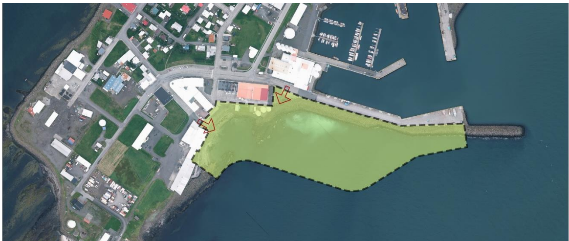
Mynd 3: Aðkomuleiðir.