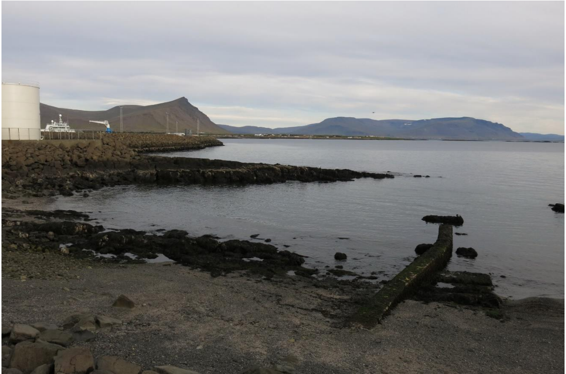
Mynd 1: Háteigsvör, Heimaskagavör og grjótvörn aðalhafnargarðs Akraneshafnar, svæði fyrirhugaðrar landfyllingar.

Með framlagningu lýsingarinnar hefst samráð um gerð skipulagsins. Óskað er eftir því að umsagnaraðilar, bæjarbúar og aðrir hagsmunaaðilar leggi fram sjónarmið og ábendingar nú í upphafi verks, sem að gagni gætu komið í skipulagsvinnunni.