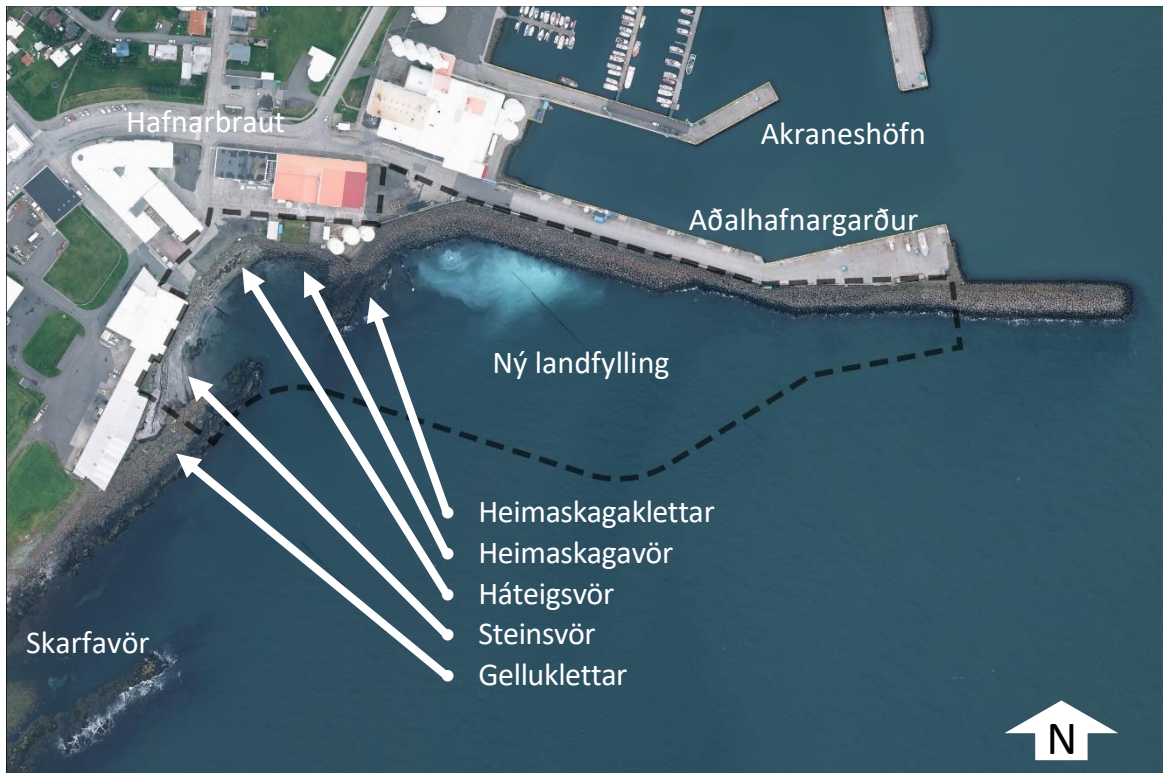
Mynd 2: Afmörkun skipulagssvæðis sýnd á loftmynd frá 2021.

Klappirnar sitt hvorum megin við víkina eru eina ósnerta landið innan skipulagssvæðisins. Byggingar og sjóvarnargarðar ná alls staðar fram á sjávarklappirnar. Neðar (sunnar) eru Sýrupartsklettur og Skarfavör sem er innan hverfisverndarsvæðis.